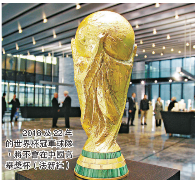
2018及22年的世界杯冠軍球隊，將不會在中國高舉獎杯

以隊長身份帶領中國國家隊出戰2002年韓日世界杯的前國腳馬明宇，對於未能繼北京奧運後舉辦世界杯感到失望，他說：「踢世界杯和在家門口踢世界杯是兩種不同的感覺。在韓日世界杯中，我們那一代的球員感受了世界杯的氣氛，也感受到了東道主對世界杯的熱情，如果我們也能夠在自己的國家征戰世界杯，那是很大的榮譽。」