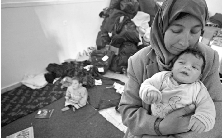
二月二日，一名巴勒斯坦婦女在加沙城的一個難民營中懷抱幼子，開始新生活

另據美聯社耶路撒冷三日最新消息，就在哈馬斯代表抵達埃及與該國官員談判以巴長期停火的條件之際，以色列阿什凱隆市三日受到一枚從加沙發射的遠程「格立德」型火箭彈襲擊，警方稱襲擊沒有造成死傷。這是該城市自以巴兩周前分別非正式停火以來首次受到火箭彈襲擊。