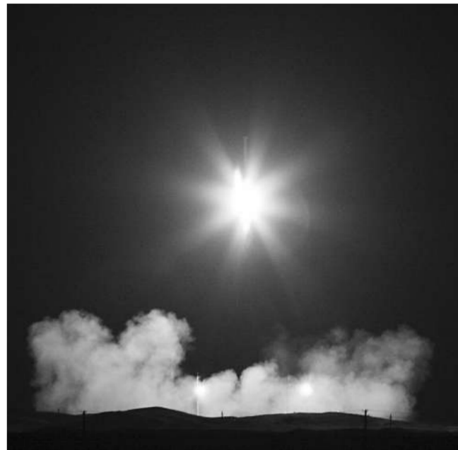
「使者2」號火箭運載伊朗首顆國產科研衛星「希望」號升空