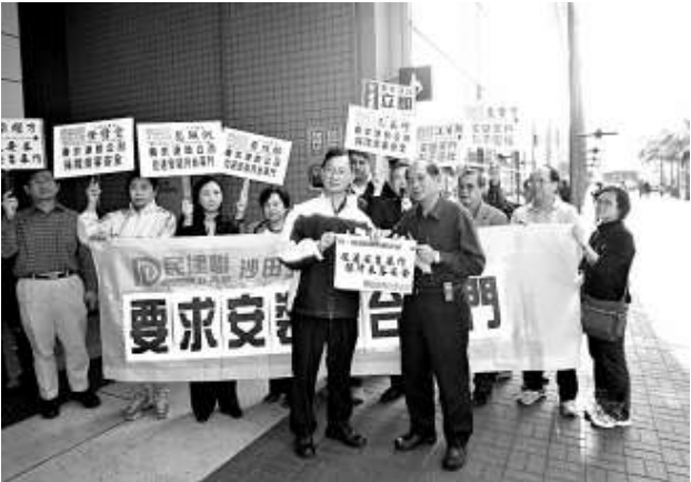
民建聯沙田支部發起請願行動，要求港鐵從速於全線月台安裝幕門（本報攝）

民建聯沙田支部建議，港鐵於東鐵及馬鐵月台加建半幕門，即類似港鐵欣澳站之半幕門，既不會影響月台通風問題，又不會影響觀景，又可大大節省成本。他們指過往亦多次舉行請願行動，要求港鐵全線安裝月台幕門，但卻遲遲未有加建，罔顧乘客安全。為此，他們昨日再次發起請願行動，強烈要求港鐵從速於全線月台安裝幕門，保障市民安全。