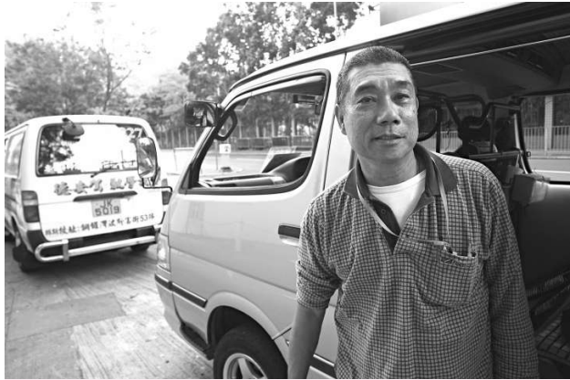
教車師傅擔心，新規定實施後，將影響急於「搵食」的輕型貨車司機生計

私家車牌，但不及格的陳先生說，不會急於一時趕在二月九日前報考，因為掛不掛P牌實際上影響不大，反而可更確保自己的安全。