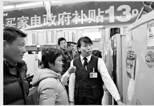
廣東省正式啓動「家電下鄉」，將對家電給予13%的補貼

據了解，在1月公布的「家電下鄉」產品招標中，廣東省家電企業收穫頗豐。如TCL集團，其彩電、手機、冰箱、洗衣機四大品類產品合計113款產品中標，並獲得「家電下鄉」30餘個省（區、市）的流通企業資格。其中彩電項目就有30款產品中標，是彩電企業中中標數量最多的。目前，廣東省55家家電中標企業正在廣東省各縣區、鎮和有條件的村莊設立銷售網點，從產品、渠道、服務等方面爲家電下鄉做好準備，努力提高農村消費者對家電下鄉的滿意度。