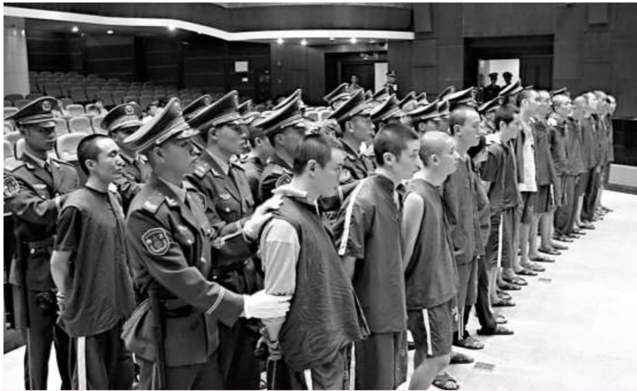
廣州去年青少年犯罪急升五成，對社會治安造成巨大壓力

廣東警方人士指出，一些失業或待業外省籍青少年已成爲具有違法犯罪傾向的「高危人羣」，預計最近各地「兩搶一盜」（搶劫搶奪盜竊）等侵財型犯罪、涉眾型犯罪和暴力犯罪將會上升趨勢。據東莞市公安局去年對大嶺山、清溪、企石、中堂等10個鎮進行抽樣調查統計，在刑事拘留的3838人中，因失業後犯罪的嫌疑人共有330人。