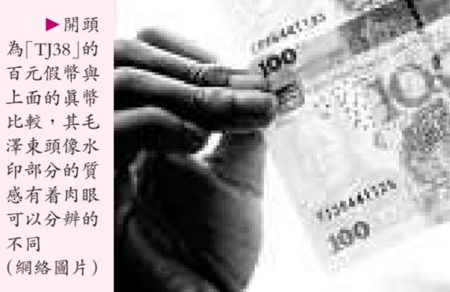
開頭爲「TJ38」的百元假幣與上面的真幣比較，其毛澤東頭像水印部分的質感有肉眼可以分辨的不同

前日，澳門警方通報稱，在當地，發現10張以TJ38打頭的百元偽鈔，該偽鈔仿真程度與早前在市面上發現的HD90字頭偽鈔相若。