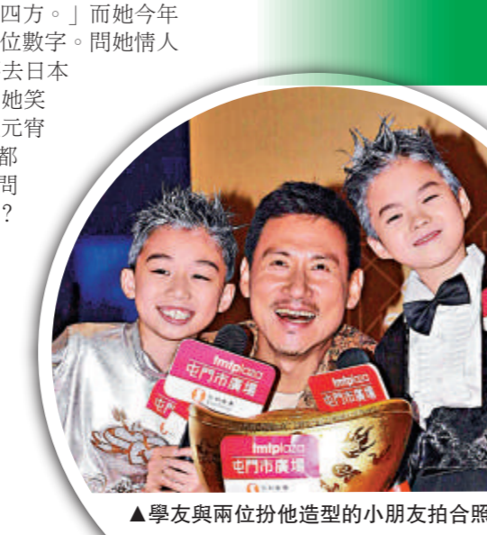
▲學友與兩位扮他造型的小朋友拍合照