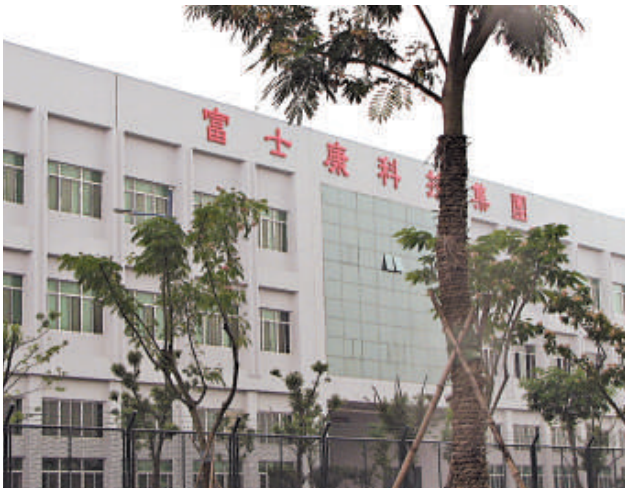
富士康已準備返台上市

陸股IPO迄今尚未啓動，未掛牌的大陸企業正大排長龍，台資企業想要在大排長龍的首批發行名單出現，實不容易。台資企業倒不如衣錦還鄉，回台灣掛牌，可以得到更高的關注、更透明的上市時程，以及政策的扶持。