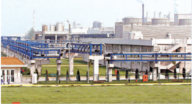
金融海嘯無礙台商在江蘇進行投資。圖為位於江蘇昆山市的台資企業

江蘇省台辦表示，今年該省將放大兩岸直航效應，加大對台灣生物科技、精密機械和新能源、新材料等高新技術產業項目的引進力度，支持南京、無錫等地加大對台灣軟件產業和動漫產業企業、人才和技術的引進，推動蘇州地區進一步加強對台灣電子信息產業研發和銷售機構的引進，使當地產業鏈更加完整。同時，在國際金融海嘯和宏觀經濟形式複雜多變的情況下，針對台企存在的困難，江蘇省將注重引導台資企業與該省科研機構和高等院校的聯繫與合作，加強科技成果在台資企業的轉化，努力提升其生產技術水平，並推進台資企業與商標品牌管理部門的聯繫溝通，引導台資企業由代工生產向自創品牌發展，支持和幫助台資企業轉型升級。