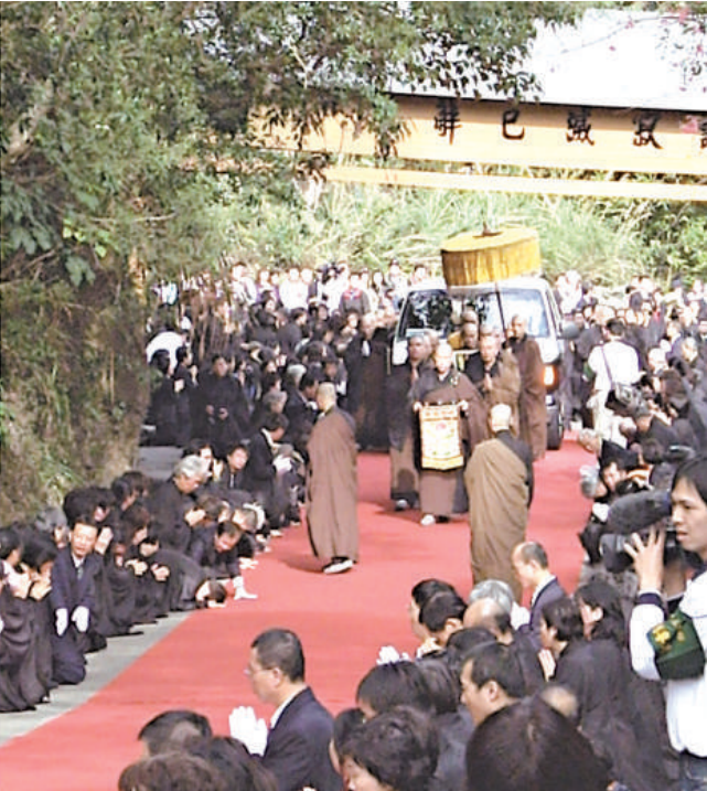
聖嚴法師荼毘大典八日舉行，當靈車抵達時，信眾下跪頭佛號

法鼓山發言人果肇法師表示，師父法身荼毘後[舍利函]將安奉在法鼓山大殿，持續舉行念佛法會，並開放給信眾參與，預定十五日將法師的骨灰殖葬在法鼓山金山生命園區。聖嚴法師於三日下午四時圓寂，享壽七十九歲。聖嚴法師十三歲出家，一生到世界各地致力宣揚佛法，一九九八年被台灣天下雜誌譽為「四百年來對台灣最具影響力的人士」之一。