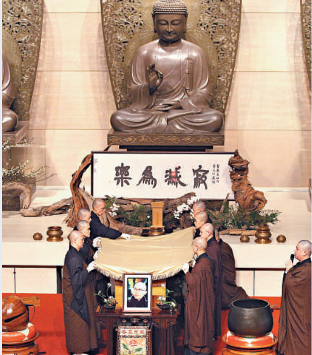
法鼓山世界佛教教育園區大殿舉行聖嚴法師起齋儀式，弟子們為老和尚覆華幔