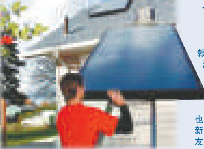
◀環保的太陽能板價格不菲

【本報訊】據英國《獨立報》八日報道：英國是受金融海嘯衝擊最嚴重的國家之一，經濟步入衰退，許多新人不僅推遲結婚，更往往會要求親友與他們「共甘苦」，就連烤爐和麥糰機也由親友來「分擔」。甚至有新人列出「蜜月清單」，讓親友認購他們度蜜月的項目。