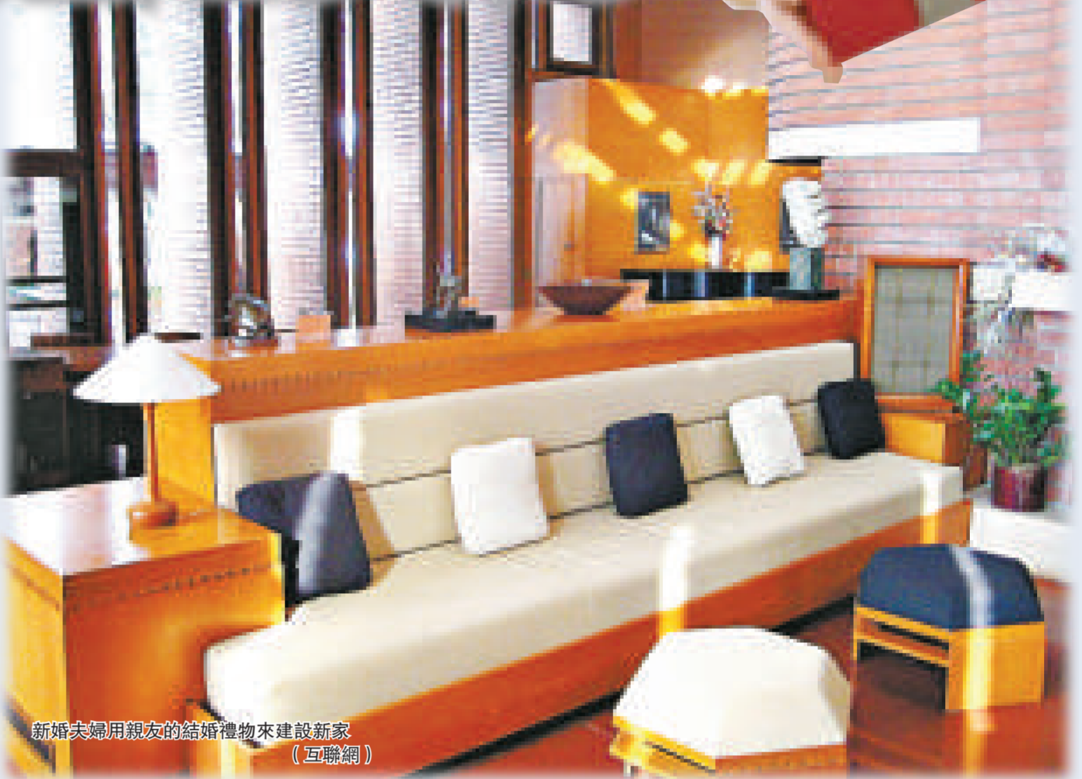
◀新婚夫婦用親友的結婚禮物來建設新家