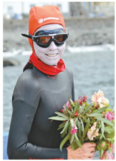
▲菲格用近一個月時間成功橫渡大西洋

【本報訊】據美聯社波多黎各八日電：一名五十六歲的美國婦女以將近一個月的時間游泳橫越大西洋，成為完成這項壯舉的第一位女性。