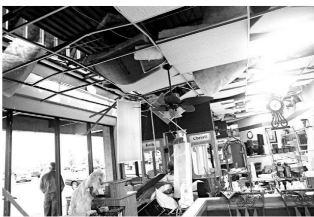
美國俄克拉何馬城的一家餐廳受到龍捲風重創

另一股龍捲風吹襲俄克拉何馬城附近，一家墨西哥餐廳的經營者和職員被迫躲進冷藏室。在埃德蒙鎮，一家車身修理店的經理下班離開不久，店子就在風災中被毀。該城有超過二萬九千居民停電。