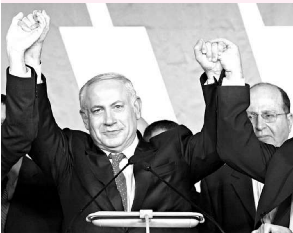
▲右翼的利庫德領導人內塔尼亞胡