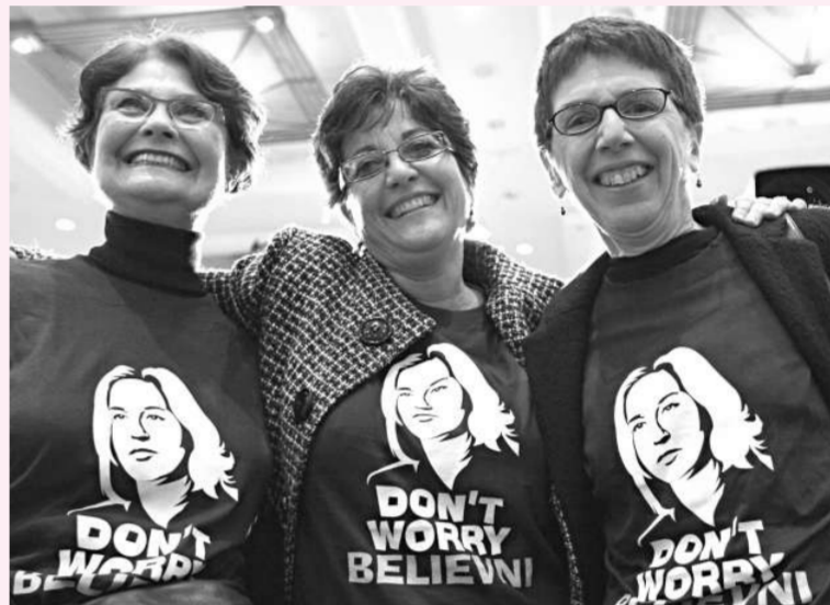
▲利夫尼受到許多女性選民的支持