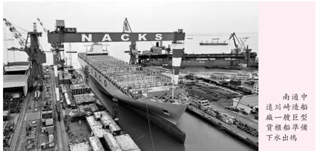
南通中遠川崎造船廠一艘巨型貨櫃船準備下水出塢

另悉，國務院總理溫家寶十一日主持召開國務院常務會議，審議並原則通過船舶工業調整振興規劃。會議認為，加快船舶工業調整和振興，必須採取積極的支持措施，穩定造船訂單，化解經營風險，確保產業平穩較快發展；控制新增造船能力，推進產業結構調整，提高大型企業綜合實力，形成新的競爭優勢；加快自主創新，開發高技術高附加值船舶，發展海洋工程裝備，培育新的經濟增長點。