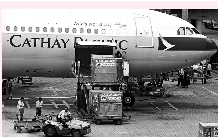
國泰航空貨運量急跌

不過業內人士認為，目前航運市場雖然出現了反彈，但前景仍然模糊，反彈到什麼程度，會不會出現大的動盪，很難預測。