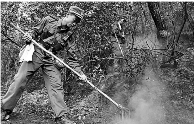
部隊官兵在撲滅餘火

但下午五點，高砂鎮黨政辦副主任在電話裡告訴記者，在風勢的影響下，有八個受災的村子出現了不同程度的復燃。目前，軍民們仍在山上撲救，已控制的區域則加緊巡山，消滅餘火，嚴防死灰復燃。據悉，災情發生後，三明市森林防火指揮部已組織發動部隊官兵、預備役人員以及縣、鎮、村幹部及群眾五千多人，分批次、分片區地參與撲火工作。