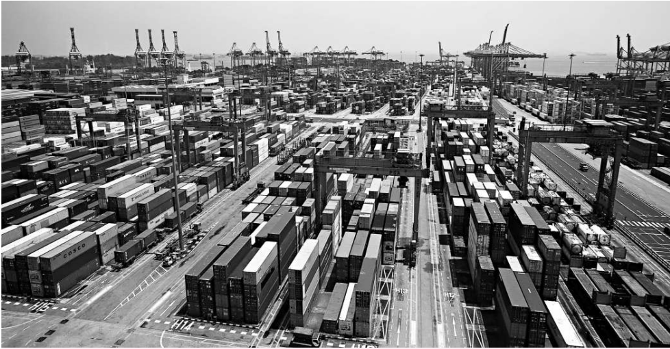
亞洲區內航運業涉及不同行業，要定出一套公正制度，必須要有高層次組織來討論。圖為新加坡貨櫃碼頭

伊藤在會上提出這項新建議，認為在國際海事組織（IMO）框架下成立具有聯合國組織權威性質的亞洲中心，再創辦一個政府與政府間合作性質的亞洲國際海事組織論壇。前者的主要任務是收集和分析處理各種區內海事信息，並將其提交給論壇進行探討。伊藤在該論壇進一步解釋他建議和看法，並不忘推薦日本在這方面的優勢，表示日本有豐富的人才儲備，同時在安全和環境方面的技術也具有長處。因此日本應該帶動亞洲其他國家一起，為全球海事作出前瞻性的貢獻。