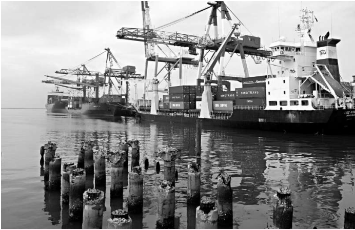
馬尼拉港水深港闊，地理位置佔優，成為菲律賓其中一個船主選擇的灣水港

全球經濟不景氣，貿易放緩，船公司把船隻閒置，削減成本。該國卻在今年的環球危機中另闢一條生財之路，成為船舶灣水熱點。不過，船公司切記要在夏季風季來臨前把船隻搬走，否則將損失慘重。