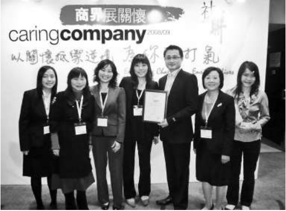
鴻星集團連續五年榮獲「商界展關懷」標誌