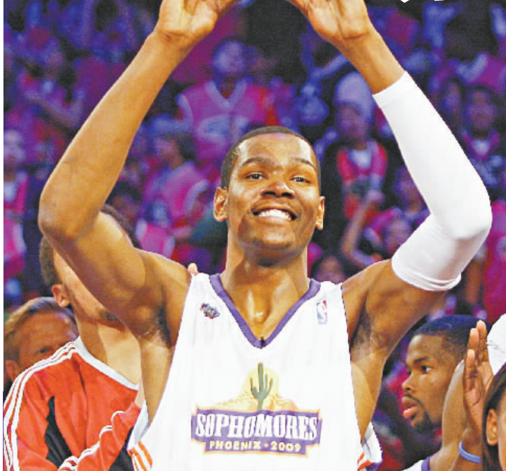
▲轟入46分的杜蘭特高舉新秀賽 MVP 獎座