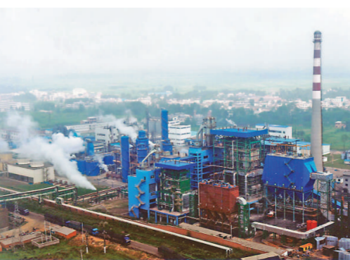
亞洲最大的天然礮礦——桐柏安棚礮礦

床，礮面面積10.74平方公里，天然礮可採儲量4849萬噸，分別位於亞洲第一，世界第三；具有埋藏深、雜質少等優點，是生產重質純礮的理想原材料；安棚礮礦所屬的安棚礦區，西距南陽焦枝線95公里，東距信陽陽廣線125公里，礦區有公路與312國道相接，均為瀝青路面，國家西部開發十大工程之首的「寧西鐵路」從礦區穿過，交通十分便利，物資輸入輸出通暢。立足資源優勢和技術優勢，採用先進的倍半礮生產工藝和科學的管理方法，我公司生產的低鹽重質純礮產品具有品位高、成本低、質量好的特點，質量優於國際一類優等品，能與美國天然礮相抗衡，產品供不應求，市場前景好。