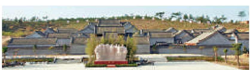
全國百家紅色旅遊經典景區——桐柏革命紀念館

桐柏是中國革命搖籃之一。3個中央級、6個省級、9個地級等黨政軍領導機構先後在此建立；包括劉少奇、李先念、彭雪楓、楊靜宇等老一輩無產階級革命家在內的304位共和國元帥和將軍曾在此生活和戰鬥過。在1938年至1948年10年間，毛澤東發出的諸多電文中26處提到「桐柏」和「桐柏山」，作為一個縣這是絕無僅有的。七十年代末，由《桐柏英雄》改編的電影《小花》，風靡全國。中共中央中原局葉家大莊修復工程被列為全國百家、全省四家紅色旅遊經典景點之一。