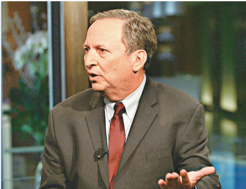
▲財政部長蓋特納（左）和國家經濟委員會負責人薩默斯（上）將共同監督「總統汽車專案小組」的工作