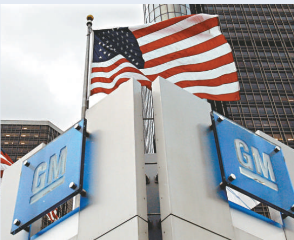
位於底特律的美國通用汽車公司總部