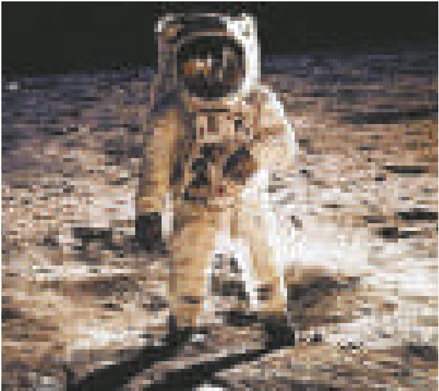
陰謀論指，「阿波羅十一號」的登月畫面是在美國內華達沙漠中某個軍事禁區中拍攝的（互聯網）

【本報訊】據英國《星期日鏡報》報道，在美國太空總署（NASA）今年夏天即將慶祝「阿波羅十一號」太空船登月四十周年紀念日之際，相信登月事件是謊言的美國人，已從一九七九年的百分之六激增至現在的百分之二十二，即至少六千萬美國人相信「登月陰謀論」。