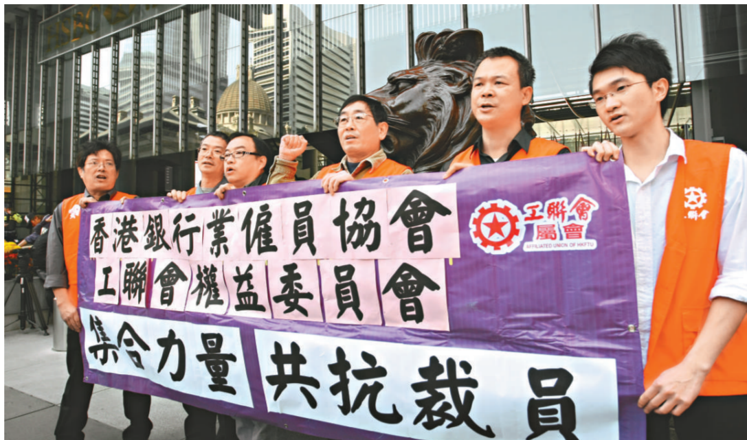
本港企業陸續出現裁員減薪的情形，工聯會發起「監察企業良心運動」，以維護基層員工權益、社會穩定和市民信心

大企業、大公司，特別是仍在賺大錢的大企業和大公司，首先難辭其責。他們多年來風光的業績、可觀的盈利，包括高層以千萬計的年薪、花紅收入，全部來自港人社會；他們在宣傳廣告或要推銷一些新項目、要加價加費時，是「好話說盡」，如何如何視員工為一家人，如何如何視香港為家，市民、客戶才是「老闆」，然而，「海嘯」風浪淹至，首當其衝的中小企，不少老闆已經左支右絀，但借錢也要給員工出糧；環環環尾細小的茶餐廳，老闆也懂得講一句「共渡時艱」，寧願「白做」也不炒員工，但盈利仍以億計的電盈、滙豐，卻已經等不及的帶頭向員工開刀了，他們向社會發出的是自私自利、唯利是圖的負面訊息，市民看到的完全是一副無情無義、