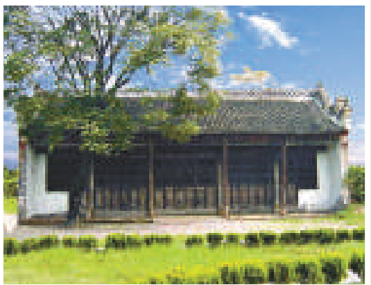
國家級紅色旅遊景區——王大灣會議舊址

光山革命豐碑林立，曾是大別山革命根據地的重要組成部分，鄧小平、劉伯承、徐向前、李先念等老一輩革命家在這裡留下了光輝的戰鬥足跡，王大灣會議舊址、徐畝鄧鄧院首府機關舊址群、鄧穎超祖居等革命遺址達535處，革命戰爭年代，10多萬光山優秀兒女用血肉之軀捍衛了紅色政權，尤太忠、萬海峰、錢鈞等數十位光山籍將軍從這裡走向全國。