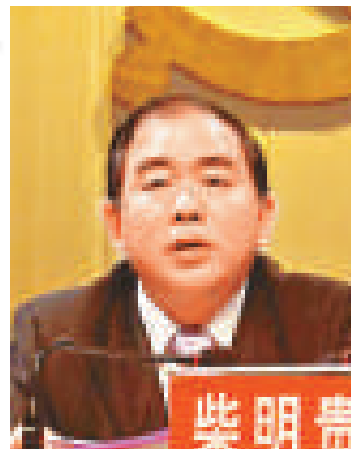
光山縣黨委書記柴明貴