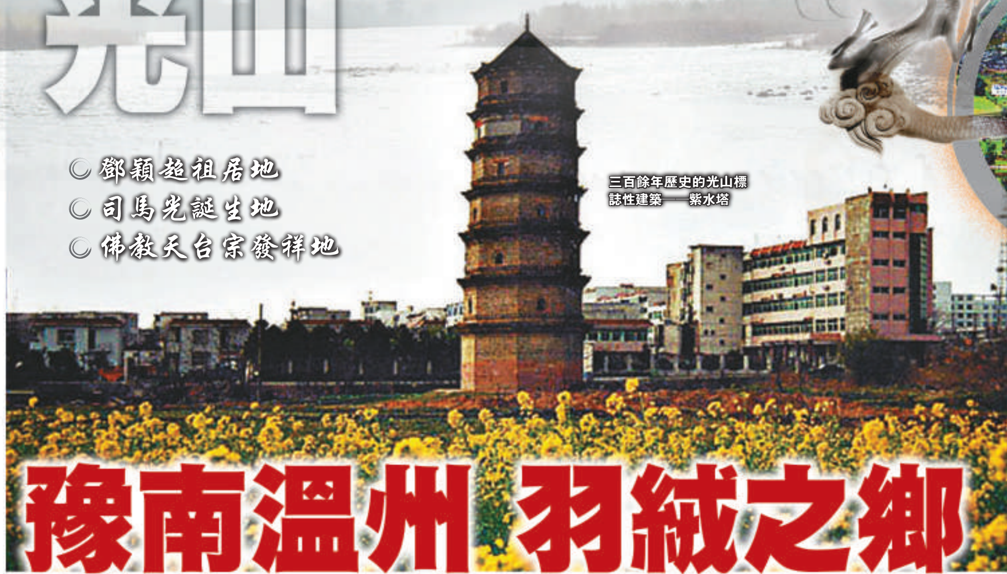
三百餘年歷史的光山標 誌性建築——紫水塔