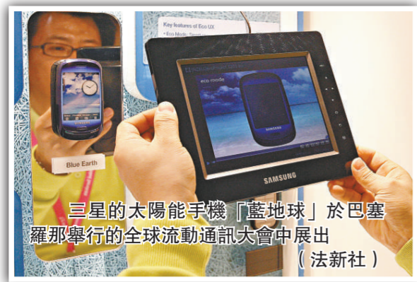
三星的太陽能手機「藍地球」於巴塞羅那舉行的全球流動通訊大會中展出