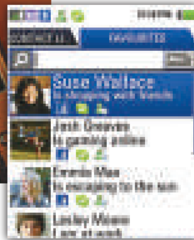
▲INQ1能即時更新友人的Facebook照片 (互聯網)

本港首富李嘉誠旗下的和記黃埔有限公司正式成為世界手機製造商的生力軍。這家名為INQ的新公司屬於和記黃埔旗下。該公司的第一款手機INQ1已於去年在英國和澳洲上市，本年上半年將推向和記黃埔網絡的其他七個市場，包括香港。一般來說，智慧手機在美國的平均價格為一百七十至二百美元 (約一千五百港元)，iPhone和BlackBerry就屬於這類手機。INQ正是要以超低的價格在智慧手機市場殺出一條血路，其批發價預計會在一百美元左右 (約七百八十港元) 甚至更低。