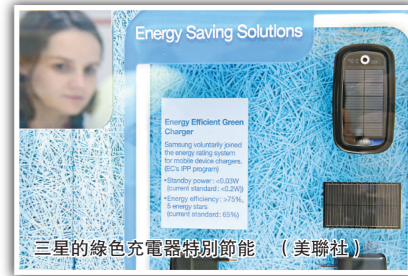
三星的綠色充電器特別節能。