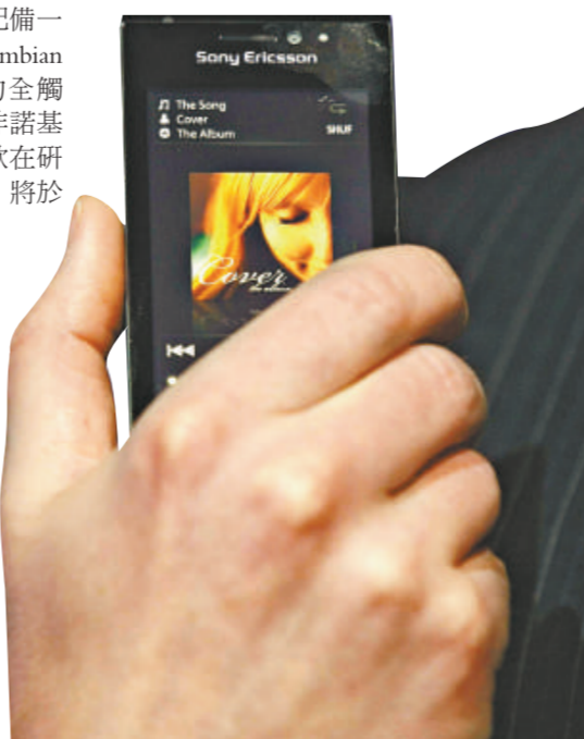
▶ S60是Sony Ericsson首部Touch Screen手機

新力愛立信還宣布一款新Walkman手機「W995」，這將是第一款提供一切攝像和娛樂內容的Walkman手機，娛樂功能可謂應有盡有。此舉將能加強該公司的品牌，並在尋求新收益的同時鞏固其地位。(美聯社)