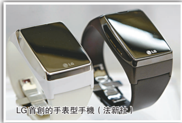
LG首創的手表型手機