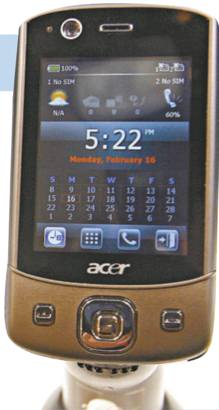
▶ Acer DX900 外型酷似iPhone

與之競爭的個人電腦兼智能手機品牌包括華碩電腦股份有限公司 (ASUSTeK Computer Inc.) 和宏達國際電子股份有限公司 (High Tech Computer Corp.)。宏達計劃分別推出面向個人消費者的Touch Diamond 2和面向商業用戶的Touch Pro 2智能手機。預計戴爾的智能手機也將很快面世。