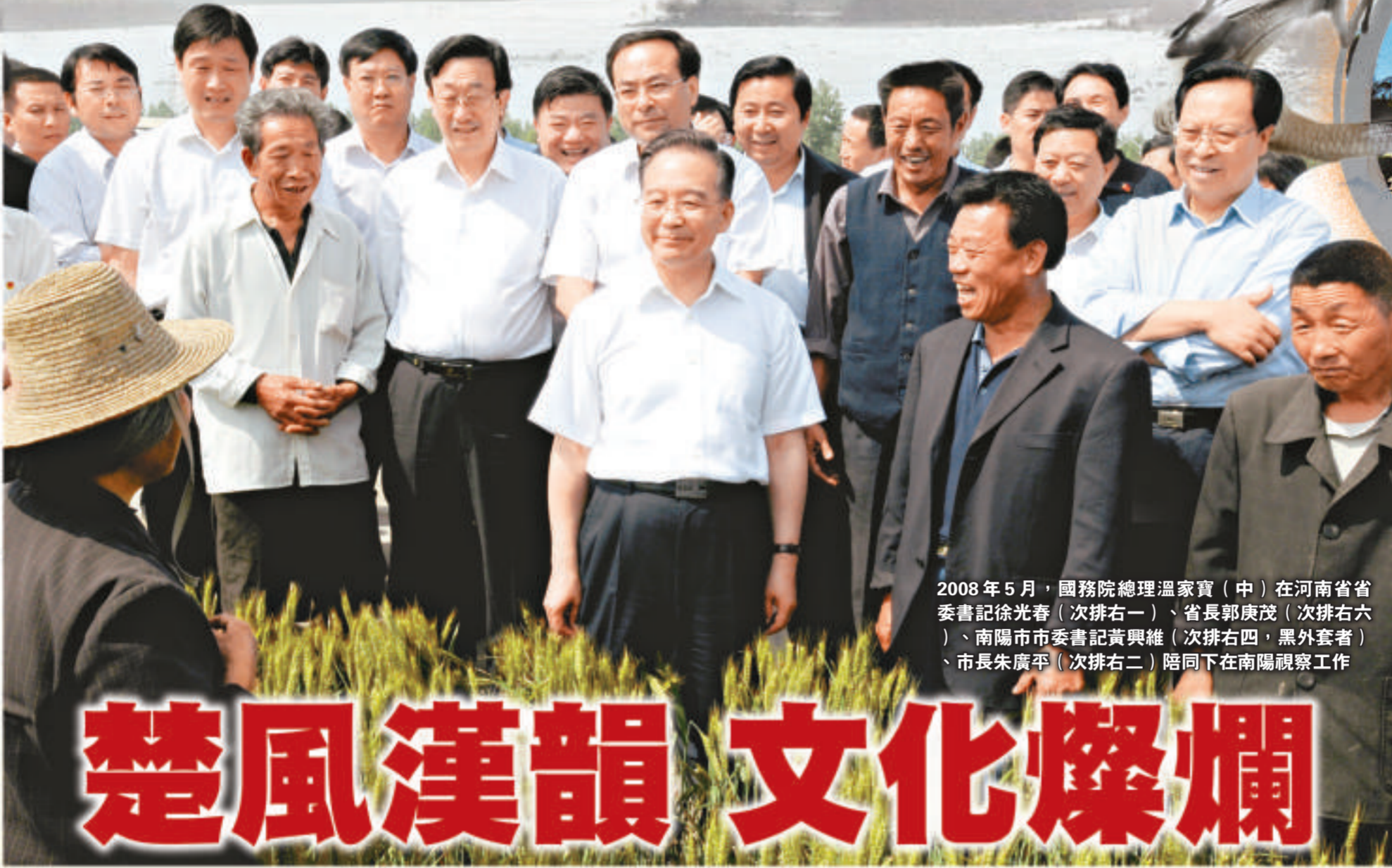
2008年5月，國務院總理溫家寶（中）在河南省委書記徐光春（次排右一）、省長郭庚茂（次排右六）、南陽市市委書記黃興維（次排右四，黑外套者）、市長朱廣平（次排右二）陪同下在南陽視察工作

南陽既是中國楚文化的搖籃，在漢代文化史上更具有舉足輕重的地位，為中華民族的發展做出了傑出的貢獻，被國務院授予「歷史文化名城」。