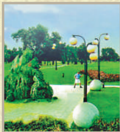
許昌市環境生態優良

許昌屬北暖溫帶大陸性季風氣候，氣候宜人。全市投入資金21億元，綠化造林2.5萬公頃，建設城市綠地1227公頃，城市綠化率達到42.7%，森林覆蓋率達到33.5%，人均公共綠地面積9平方米。花卉苗木種植面積75萬畝，是中國最大的花卉苗木生產基地。市區的水環境、大氣環境等主要環境指標均位於河南省前列，是「中國優秀旅遊城市」、「國家園林城市」、「國家森林城市」、「國家衛生城市」。