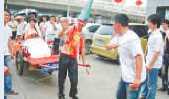
迎親途中，親友用竹條抽打新郎