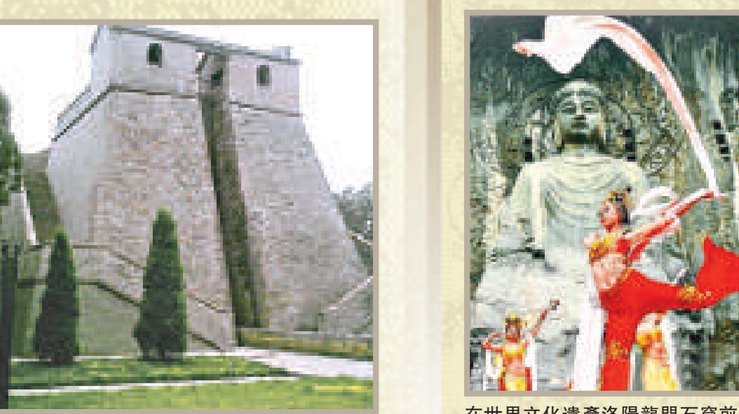
世界九大神秘古觀音台排名第二的河南省觀音臺

洛陽牡丹甲天下。而今洛陽每年四月中下旬舉辦的盛大牡丹花會，滿城牡丹競放，觀者如潮。開封每年金秋10月舉辦的菊花會，幾十萬盆菊花、上百個品種，滿城菊香。