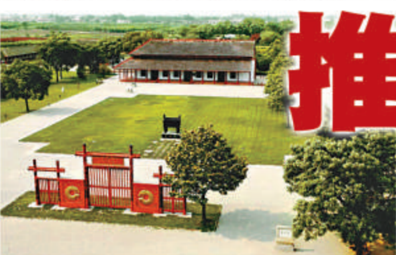
世界文化遺產——殷墟

文化大省河南近年來發掘文化資源，實施「文化強省」戰略。在實現「中原崛起」這一偉大的目標中，中原文化將起着不可估量的作用。發掘中原文化的力量，為中原崛起提供支撐，成為河南社會各界的共識。中原文化，因其獨特性，勢必推動中原崛起。