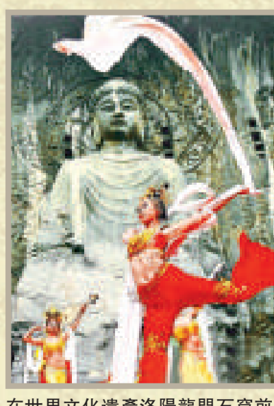
在世界文化遺產洛陽龍門石窟前，唐樂舞古韻悠長