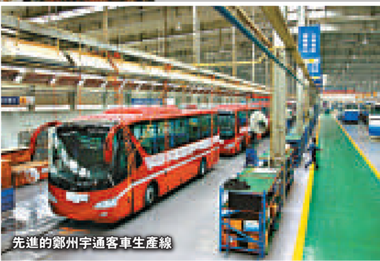
先進的鄭州宇通客車生產線