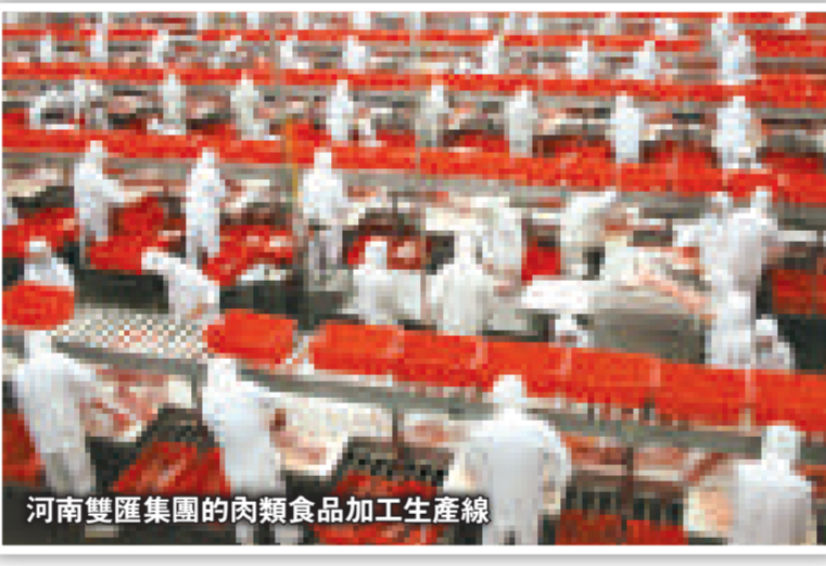
河南雙匯集團的肉類食品加工生產線