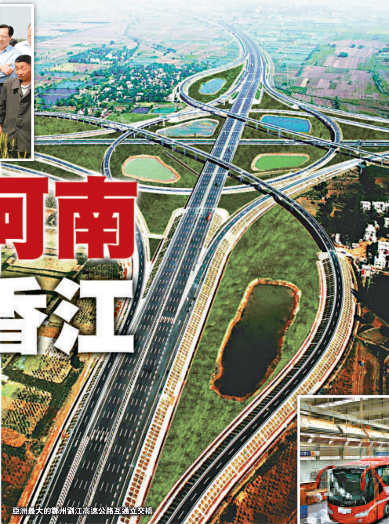
亞洲最大的鄭州劉江高速公路互通立交橋