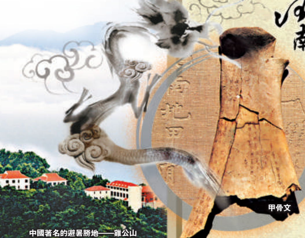
中國著名的避暑勝地——雞公山