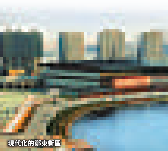
現代化的鄭東新區

河南與港澳在產業發展上有極強的互補性，雙方的經貿合作有著良好的傳統，同時也具有巨大的潛力。早在上世紀60年代，河南就是港澳活豬、活雞、雞蛋的主要供應者。最高一年，供港鮮活食品佔全國供港量的20%。改革開放後，河南與港澳的合作得到進一步加強，目前河南利用港澳資金佔全省利用外資和港澳資金直接投資的1/3。到2007年底，香港在河南累計投資設立企業444家，佔河南外資項目的47.5%。