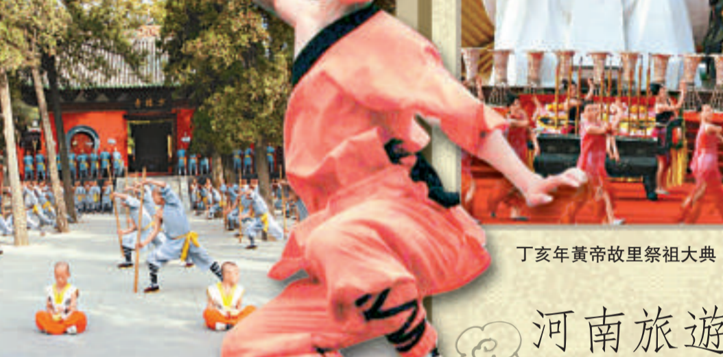
少林武術名揚海外