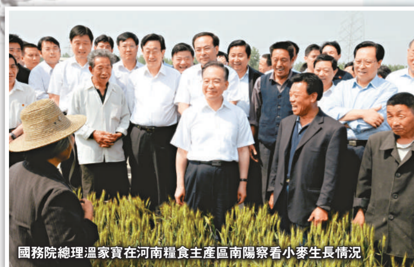
國務院總理溫家寶在河南糧食生產區南陽察看小麥生長情況