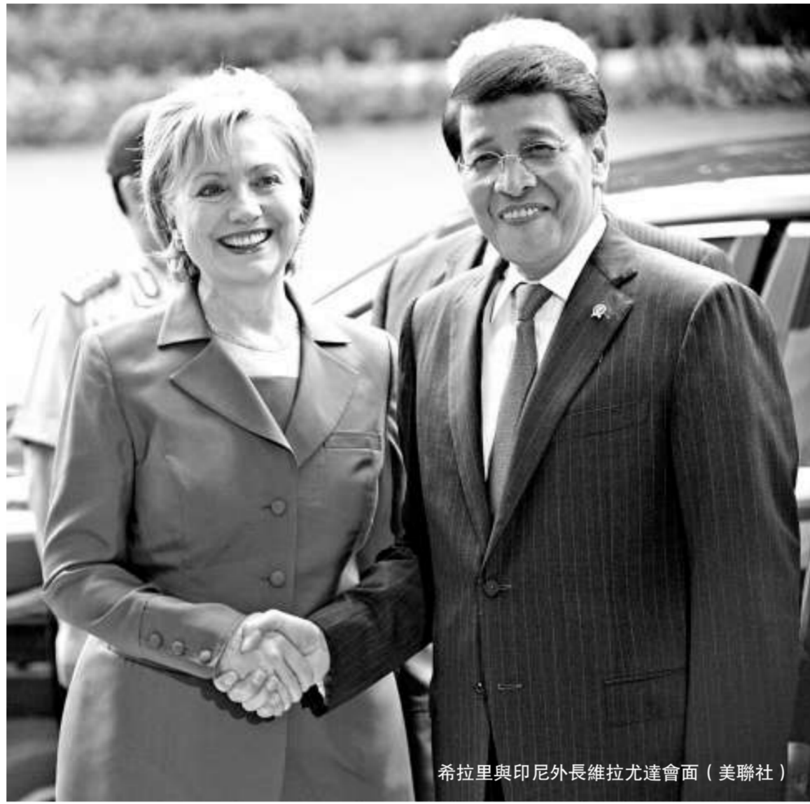
希拉里與印尼外長維拉尤達會面

英國廣播公司的報道稱，印尼社會普遍對奧巴馬政府抱有期待，認為奧巴馬會比布什更理解穆斯林世界。有分析認為，希拉里可能希望通過對印尼的訪問，來傳遞一個信息，即美國與穆斯林世界的關係不僅限於中東、阿富汗和巴基斯坦。作為世界上穆斯林人口最多的國家和伊斯蘭會議組織的重要成員，印尼可以成為奧巴馬政府與伊斯蘭世界進行交流對話的重要發展對象。