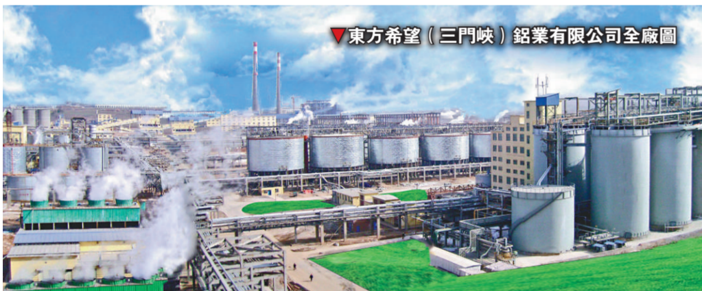
東方希望(三門峽)鋁業有限公司全廠圖