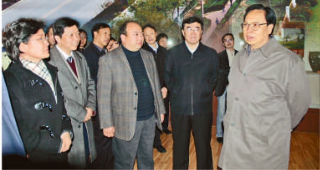
澗池縣委書記全孟蛟(左三)陪同河南省委書記徐光春視察澗池