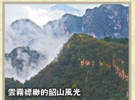
雲霧繚繞的韶山風光

招商熱線：86-398-2232615 傳真：86-398-4812380 電郵：mcxswj@163.com