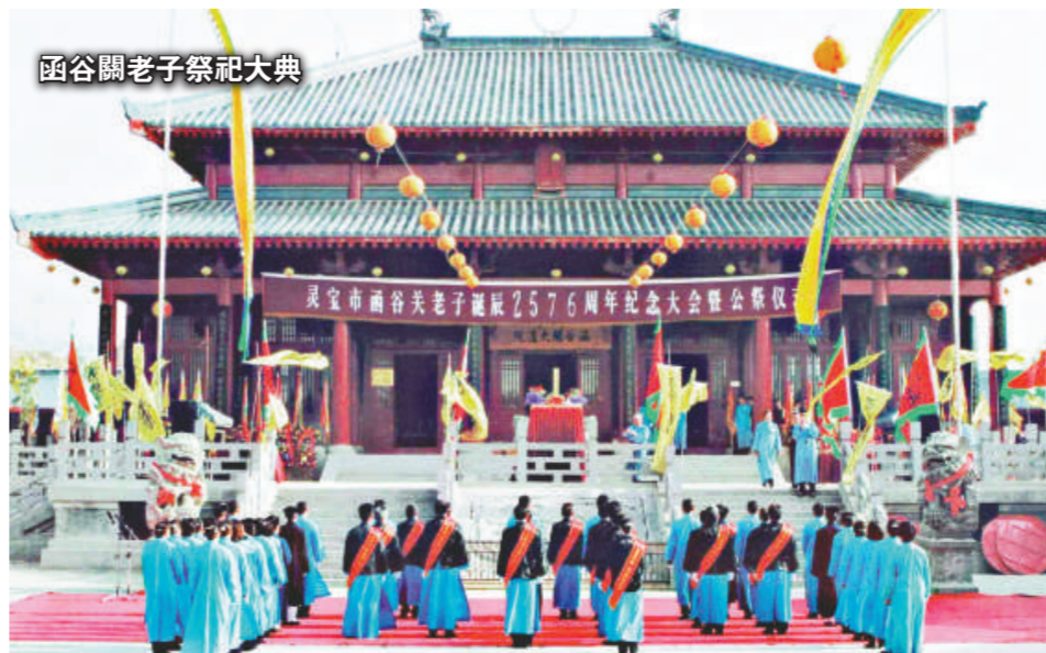
函谷關老子祭祀大典