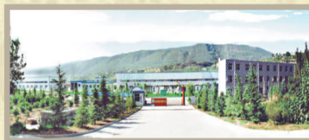
河南省果品行業規模最大、國家級農業產業化龍頭企業——河南景源果業集團有限公司