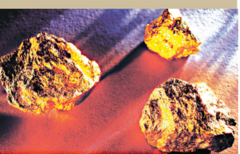
中國金城靈寶的黃金礦石