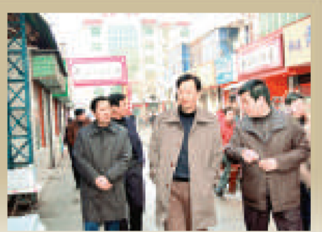
靈寶市市長喬長青（中）巡視城區