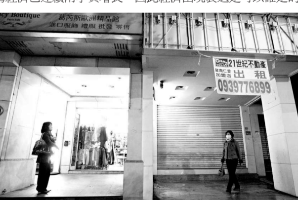
受金融海嘯影響，島內不少商舖被迫關門 (中央社)

台灣「經建會」主委陳添枝表示，由於去年第三、第四季台灣經濟已連續兩季負增長，因此經濟出現衰退是可以確定的。