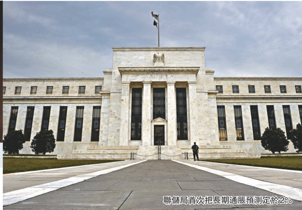
聯儲局首次把長期通脹預測定於2%

芝加哥聯儲銀行行長伊雲斯說，美國經濟收縮情況令人擔心，由現時至6月經濟仍會繼續萎縮。他表示，預計2009年下半年GDP開始有所擴張，但幅度不足以抵銷上半年的頹勢。伊雲斯稱，聯儲局及政府的措施，有助穩定金融制度，經濟可望復甦。但伊雲斯估計，失業率將持續攀升至2010年。