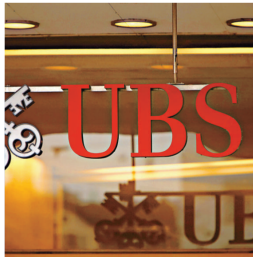
瑞銀今次支付的7.8億美元和解費用，比起市場預期的10億美元還要少

消息人士稱，瑞銀今次支付的7.8億美元和解費用，比起市場預期的10億美元還要少，原因是美國政府有見及瑞銀遭到金融海嘯的沉重打擊，同意收取比較低的和解費用。直至今在，瑞銀已公布的裁員人數達至11000人，並且撤出了部分債券交易和商品業務，並已從投資者中集資到資金320億美元，可以抵銷到證券部門所錄得的紀錄虧損。瑞銀在上周公布第四季錄得虧損81億瑞郎（69億美元），主要受交易和槓桿債務虧損的影響。