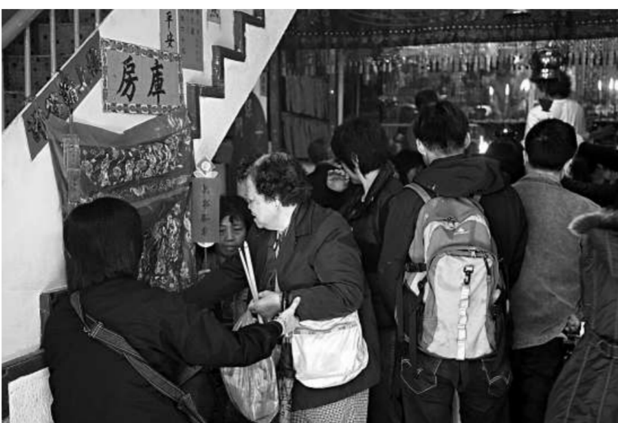
善信在太平山街觀音堂的庫房抽取吉祥語句