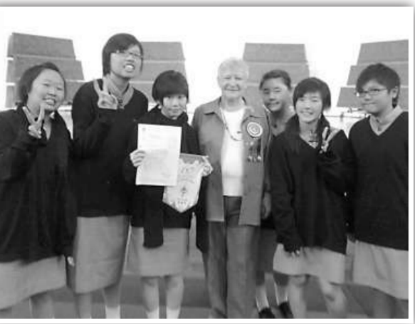
▲奪冠隊伍與評判合照 ▲賽後與老師校長共同開懷大嚼，慶祝獲獎

憑着二十八位參賽同學的辛勤付出和堅定不移的決心，她們最終取得評判的青睞和讚賞，並贏得觀眾的讚美和