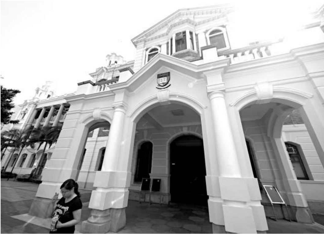
港大投資因金融海嘯減值 (資料圖片)

，有關減值不會影響港大未來百周年校園發展、大學四年制增聘二百名教職員的計劃，以及大學四年制的有關配套。而港大高層亦笑言，港大投資成績已算是「跑贏大市」，成績較美國頂尖哈佛大學好一點。