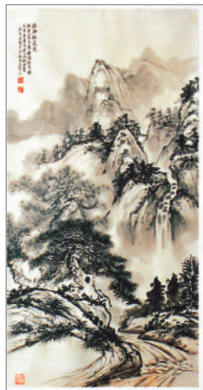
幽谷飛瀑圖 施國敦