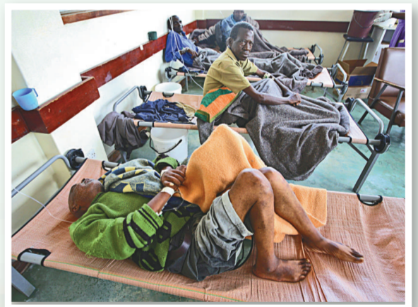
▲國家動蕩民不聊生