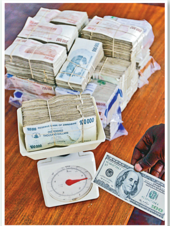
▲貨幣貶值屢創紀錄