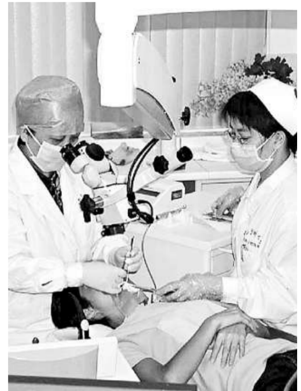
港澳人士在廣東申辦診所，已列入廣東省衛生廳整改方案之列

廣東省衛生廳廳長姚志彬表示，為促進CEPA補充協議五在廣東先行先試有關政策得到有效落實，提高辦事效率。省衛生廳直接受理有關個案的申請，自受理設置申請之日起三十日內，作出批准或者不批准的書面答覆。