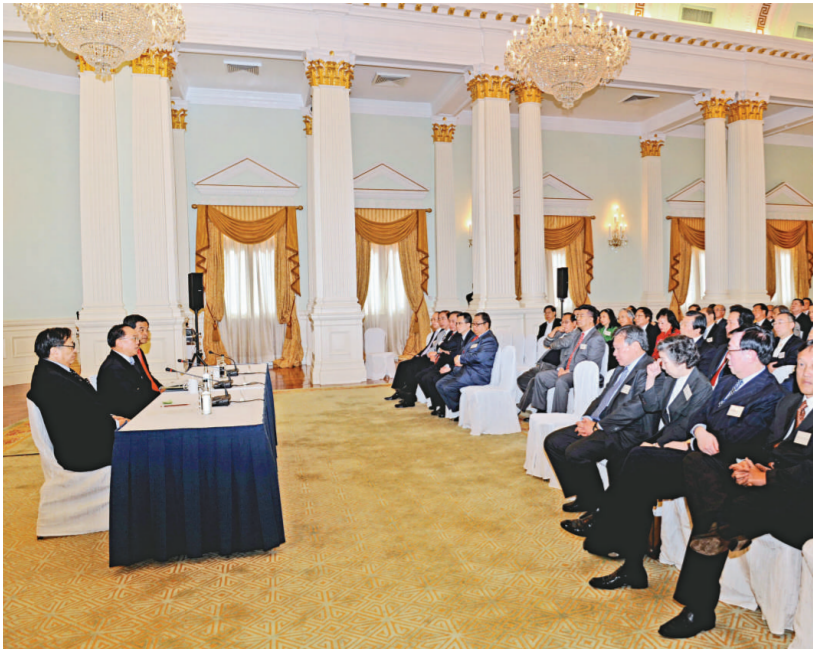
曾蔭權在禮賓府會見港區全國政協委員，聽取他們對國家及香港特區發展的意見

【本報訊】記者宋佩瑜報道：「兩會」即將於下月初在北京召開，行政長官曾蔭權昨日特地在禮賓府會見了約七十名港區全國政協委員，聽取對國家和香港特區發展的意見。會上，多名政協委員提出，希望政府進一步推進落實珠三角發展規劃綱要，並在當前金融海嘯下，提出更多協助中小企應對的政策。