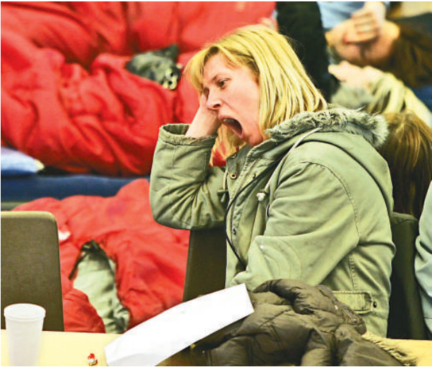
缺乏睡眠直接影響身心健康

科學家表示，每天長時間工作侵蝕睡眠時間，使人疲倦無力，這可能會增加罹患心臟病的風險。這項長達 5 年的研究發現，每晚睡眠只有 5 至 7 小時的人，提早出現血管損壞，導致心臟問題的可能性，比晚上睡眠時間較長者高出 1 倍。