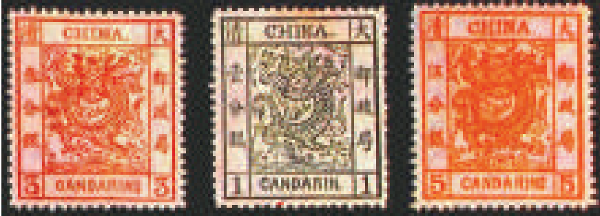
中國第一套郵票「大龍郵票」

郵票，顧名思義是郵遞信件印花票據，有如郵件的「通行證」。第一枚郵票誕生於英國，在這之前，郵件的收費手續十分繁雜，根據信件用紙的張數和投送路程的遠近，逐件計算費用，並在郵件送到後向收件人收費。