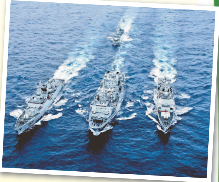
中國必須在發展經濟的同時，有針對性地發展國防力量，圖為中國潛艇演習時的情形

鄭樹龍的講學引起筆者對國家外交的興趣，在書店購買有關書籍。今期的《三聯生活周刊》介紹了「海口」號的軍事裝備，探討了國家「針對性地發展國防力量」的情況。海口號是一艘 052C 型驅逐艦，艦上載有「防空導彈垂直發射系統」，這是目前世界上最先進的軍事防禦設備。西方的軍事專家不僅估計中國的武器裝備水平可能已進入了「某些領域技術領先」的情況，而且還關心中國「何時開始建造航空母艦」。這個例子正見證了鄭樹龍教授的見解。