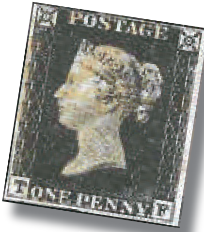
世界第一枚郵票「黑便士郵票」

多利亞登基時所拍的側面頭像為圖案，除沒有齒孔外，已大體具有今天郵票的特徵，選用帶水印的紙張印刷，塗有背膠，因採用黑色油墨，故通稱「黑便士郵票」。