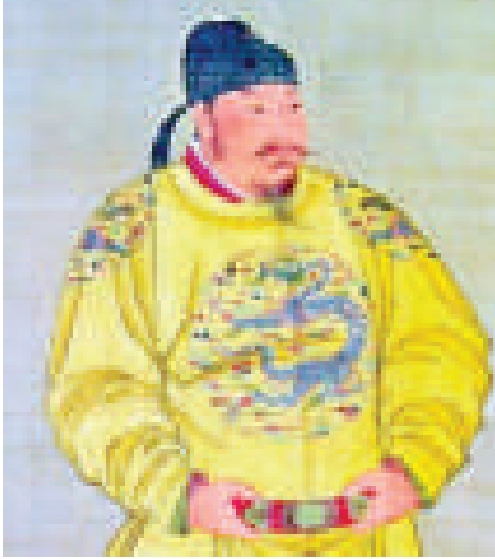
唐太宗「貞觀之治」名垂青史

唐太宗即位後，任用賢良，知人善用，虛懷納諫，重用魏徵等一批賢臣。太宗在位 20 多年，僅魏徵就直諫逾 200 次，數十萬言，皆切中時弊。他還採取以農為本、輕徭薄賦、疏緩刑罰、厲行節約、完善科舉制等政策，使百姓休養生息。貞觀年間社會治安良好，據載，貞觀四年（630 年）全國判死刑才 29 人、貞觀六年（632