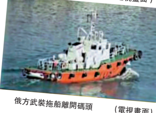
俄方武裝拖船離開碼頭 (電視畫面)