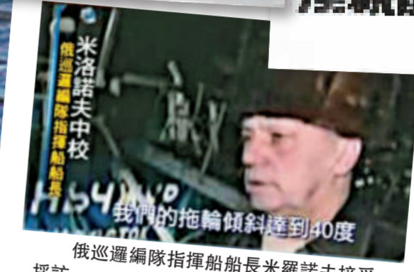
俄巡邏編隊指揮船船長米羅諾夫接受採訪 (電視畫面)