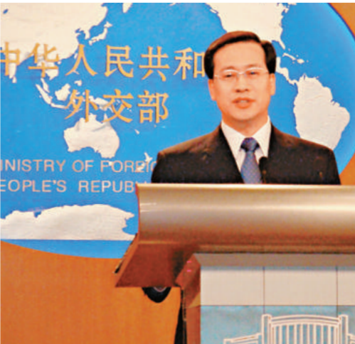
外交部新聞司長、發言人馬朝旭今天進行首度新聞發布

記者會的開場白，馬朝旭說，雖然今天是他第一次主持記者會，但看到各位記者卻像看到老朋友一樣。在發言人的崗位上，他將竭盡全力，與各位記者為促進中國與世界的相互溝通和理解共同努力。