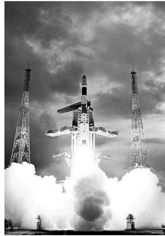
印度去年十月發射了它的首個月球探測器「月船一號」（資料圖片）

意外相信是在火箭發射數分鐘後發生。當時防止衛星在發射升空過程中受損害的整流罩，原應與火箭分離。但包括一個頭錐在內的沉重包層，未有脫離火箭，拖慢了火箭前行。這使得該枚火箭未能運載衛星到地球表面上空四百三十八英里的預定軌道。這枚衛星所牽涉的任務價值二億八千萬美元。