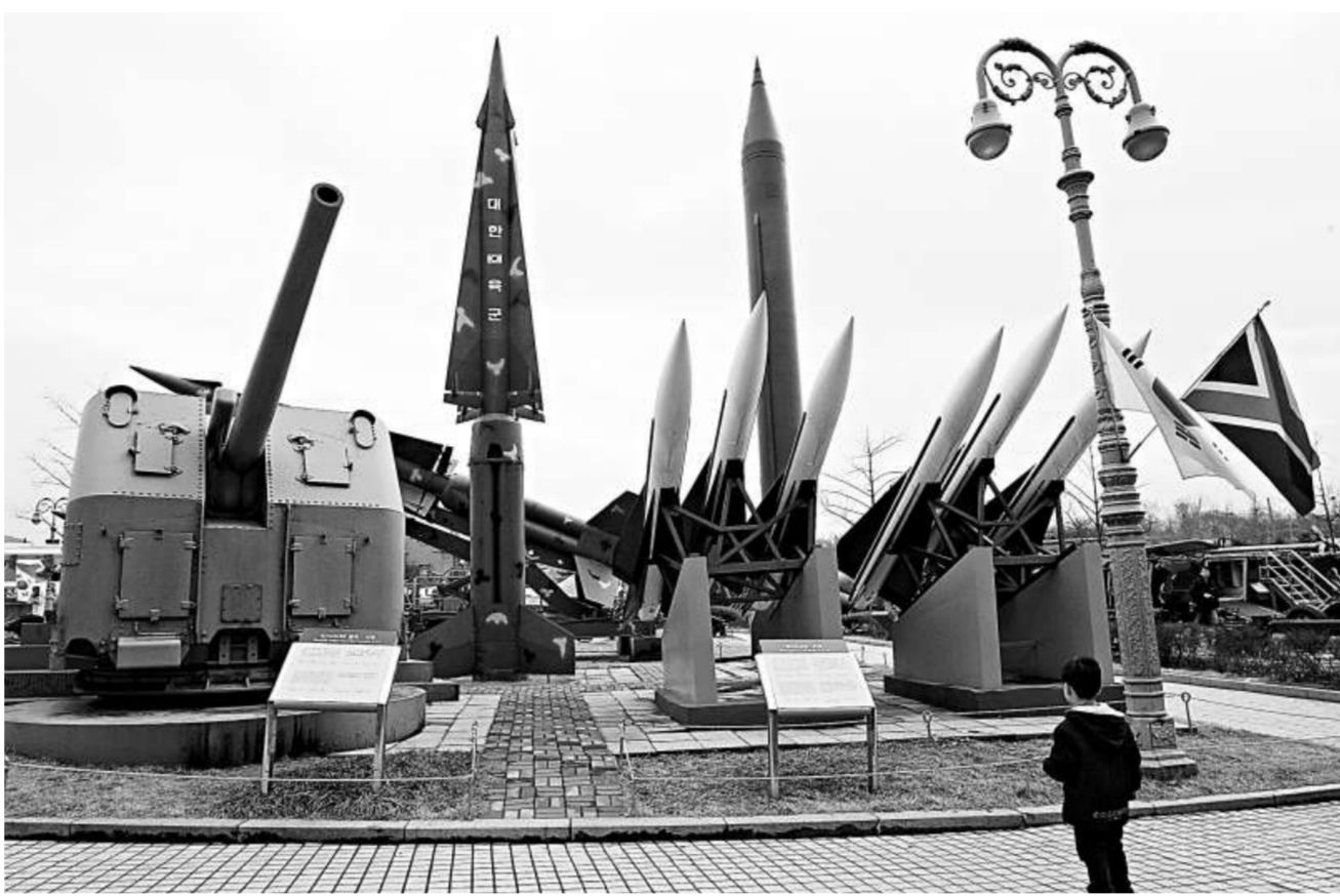
一名韓國兒童在參觀朝鮮導彈模型。朝鮮宣布即將試射「光明星二號」通訊衛星

有些分析家說，朝鮮發射的可能確是衛星，但衛星技術很容易應用於遠程導彈。專家尚無法確定朝鮮是否已有能力給導彈裝上核彈頭。