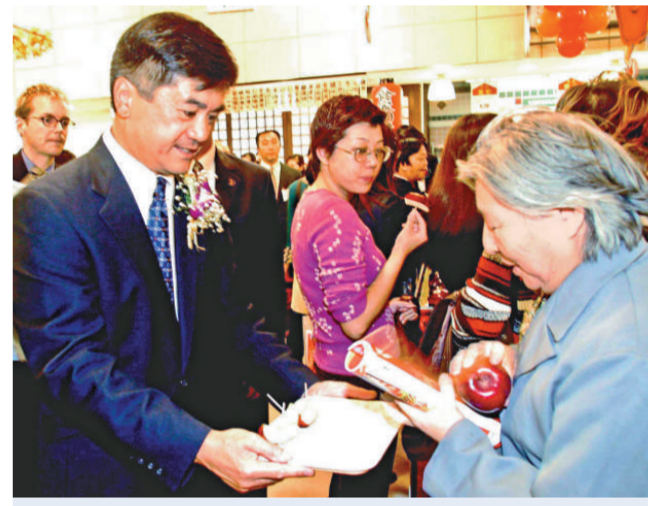
二〇〇三年，駱家輝在上海一家超市推廣美國產水果

二〇〇二年四月，駱家輝簽署了一項法案，規定華盛頓州各級政府的官方文件自七月起禁止使用含種族歧視意味的 Oriental（東方人）字眼，全面改用 Asian（亞裔）。