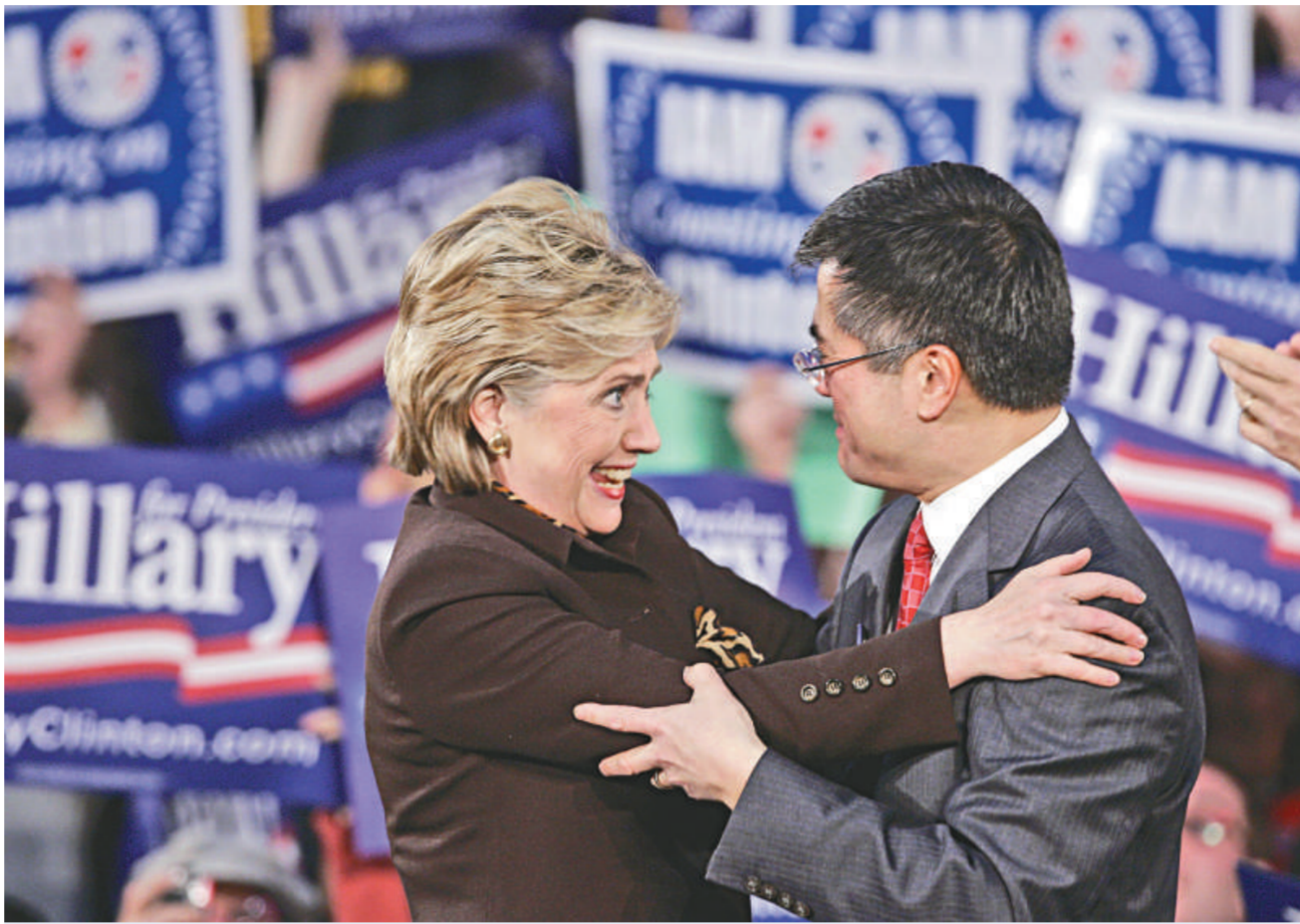
美國總統大選初選時，駱家輝是希拉里的支持者