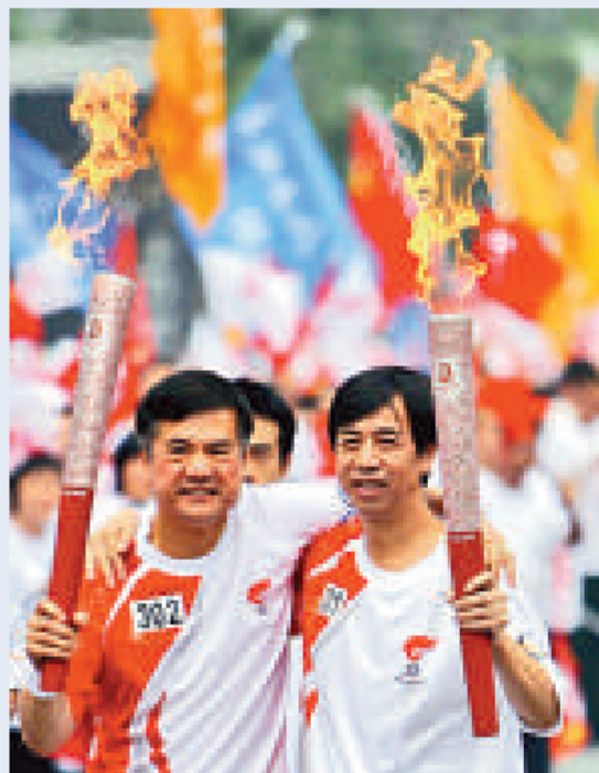
▶駱家輝（左）去年在四川省參加北京奧運火炬傳送