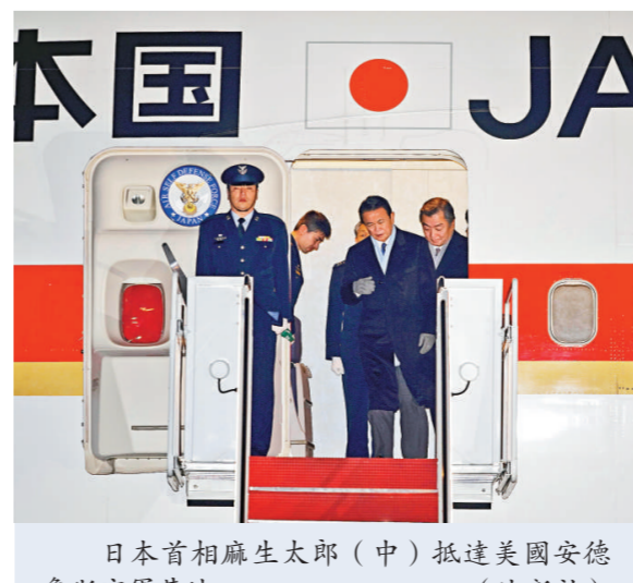
日本首相麻生太郎（中）抵達美國安德魯斯空軍基地

報端稱，無論麻生訪問華盛頓的結果如何，奧巴馬和麻生太郎的合作可能不會太長久。因為麻生的民衆支持率僅一成多一點。人們普遍認為，執政的自民黨將會失去幾十年的控制權，在即將舉行的國會選舉中敗給反對黨。