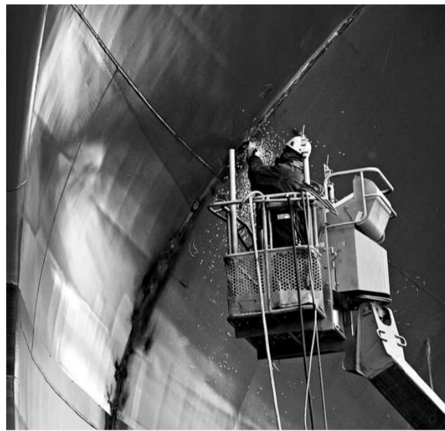
韓國政府出面，高調稱今年船舶出口額勝過去年，令人存疑。圖為現代重工船廠工人在為船打磨

去年底，武漢東西湖保稅物流中心正式獲得國家批准，總建築面積達2.2萬平方米的武漢保稅物流中心暨湖北武漢公路二級口岸聯檢大樓也破土動工，將向駐區監管職能單位提