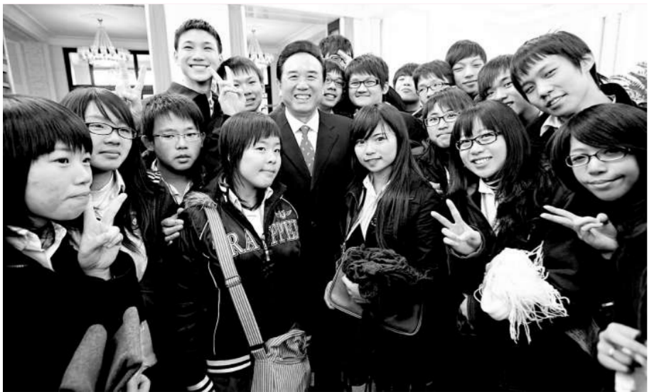
陳雲林與東莞台商子弟學校 160 多名師生代表相見甚歡