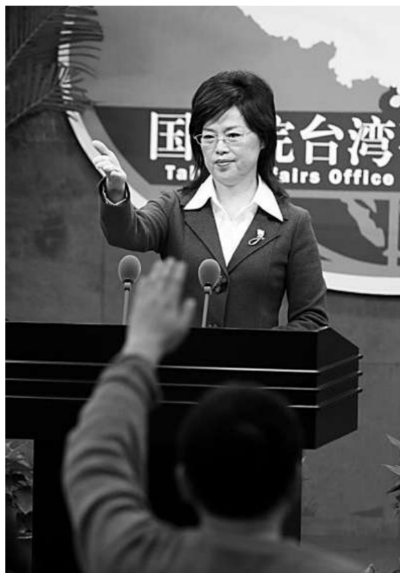
范麗青昨日表示，兩會正就相關協商議題及會談具體時間、地點協商確定（中新社）

據介紹，《海峽兩岸郵政協議》實施以來，兩岸民眾互寄郵件的數量在逐步上升，郵件傳遞的時間大大縮短，兩岸郵政系統良好的服務質量也得到了公眾的好評。初步統計，兩個月以來，大陸寄往台灣的信函約四萬公斤，包裹近七千件，特快專遞大約二萬八千件。