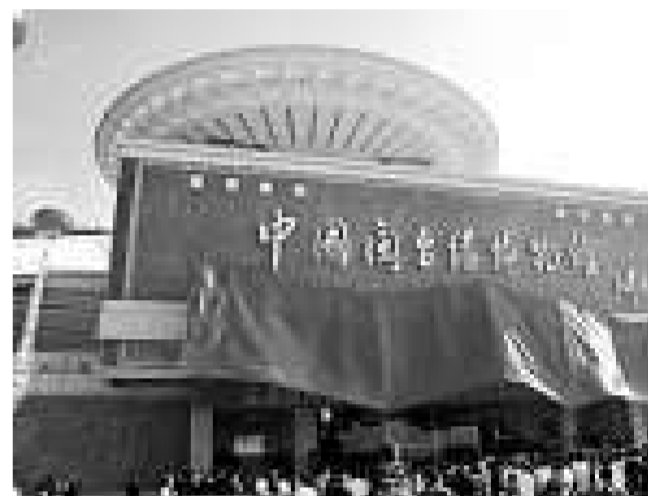
福建省省委常委、副省長陳樺、泉州市委書記徐鋼揭曉

博物館自二〇〇六年五月二十七日開館以來，已累計接待海內外觀眾一百八十二萬人，其中台灣同胞十三萬多人。目前，博物館已經逐步成為兩岸歷史文物薈萃點、海峽兩岸的旅遊新地標以及兩岸交流合作的重要平台。