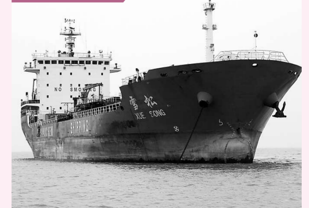
昨日下午，「雲松」號貨輪緩緩駛離浙江台州港開往台灣麥寮港。這是台州港被定為大陸首批開放兩岸海上直航的 63 個港口之一後的首次直航。