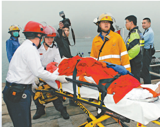
▶老婦被救起後情況危殆

水警輪與消防輪先後趕至，水警迅即將兩夫妻救上船搶救，惟老婦已奄奄一息，水警即時施救，並全速駛往附近的碼頭，將兩名事主轉送上岸，交由救護員接手救治及送院搶救。