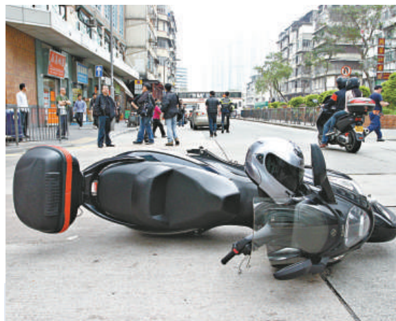
▲綿羊仔翻側在地