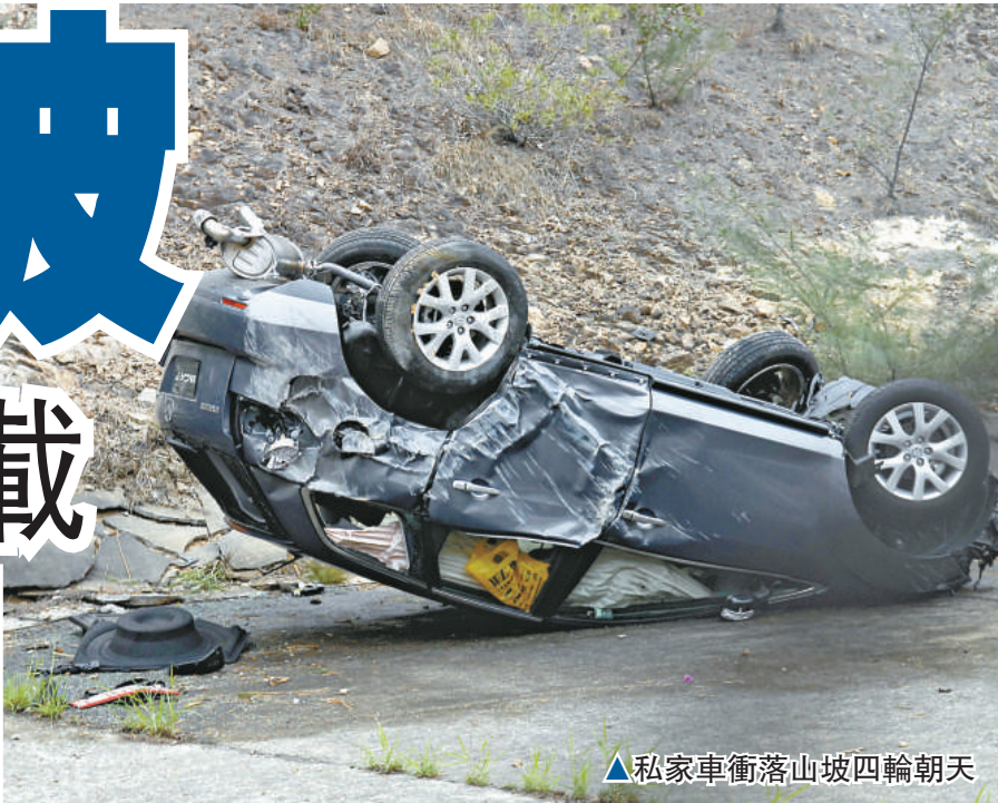
▲私家車衝落山坡四輪朝天