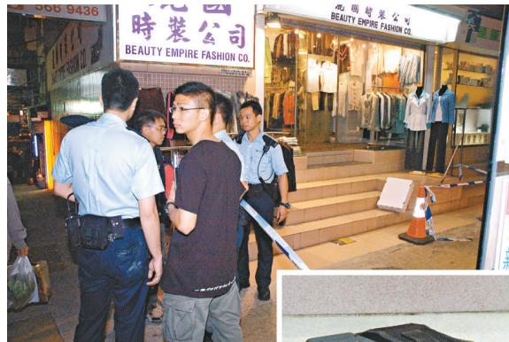
▲警員在北角擒賊檢電槍（小圖）

【本報訊】衝鋒隊巡警昨午在港島北角堡壘街截查可疑男子時，對方作賊心虛拔足逃走，警員尾隨窮追二百米至英皇道將其擒獲，除搜出膠索帶和膠水等物品外，並在附近一條橫巷檢獲一枝電槍，疑他逃走時丟棄，警方追查電槍來源及動機。