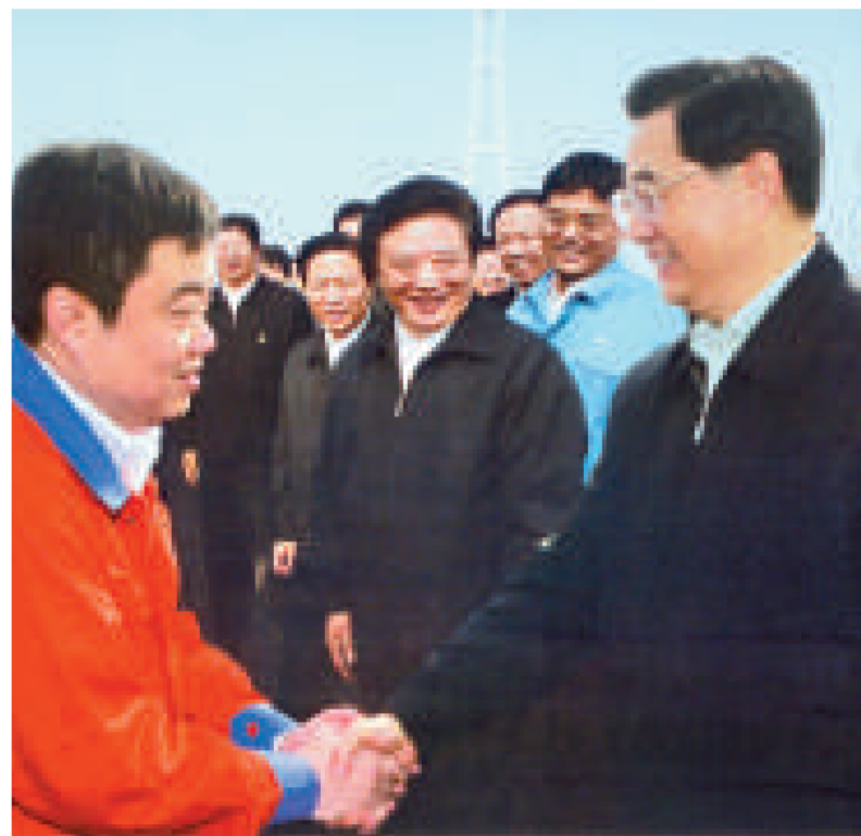
▲國家主席胡錦濤視察公司承建的南京長江第三大橋