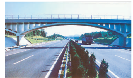
公司承建的獲「詹天佑大獎」的京珠高速公路臨長路

新工藝，出色地承建了7座長江特大橋。在橋樑大型雙壁鋼圍堰施工、大直徑深水基礎施工等領域形成核心技術，先後獲得50多項國家優質工程金、銀獎，國家、省部級科技進步獎，12項國家專利技術，創造了良好的經濟效益和社會效益，多次受到黨和國家領導人的高度評價，打造出「路橋湘軍」品牌。