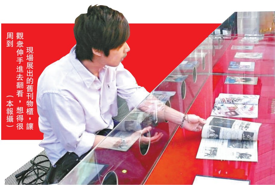
觀衆伸手進去翻看，想得很周到