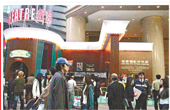
展覽現場布置成舊戲院的模樣