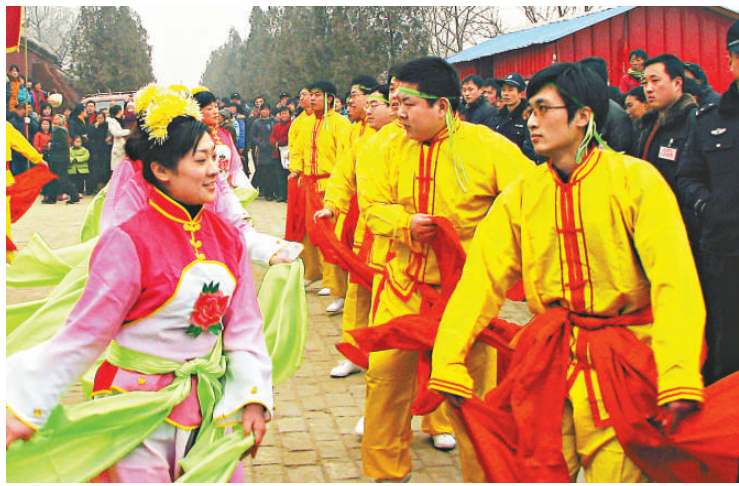
▲社火表演精彩紛呈