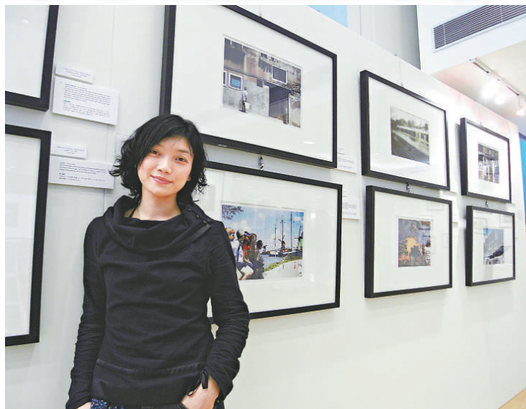
▲田旭以敏銳的攝影觸覺，捕捉歐洲影像