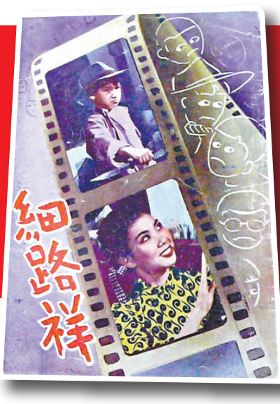
▲有李小龙的舊資料特別珍貴，這是鄭發明收藏的電影《細路祥》電影故事