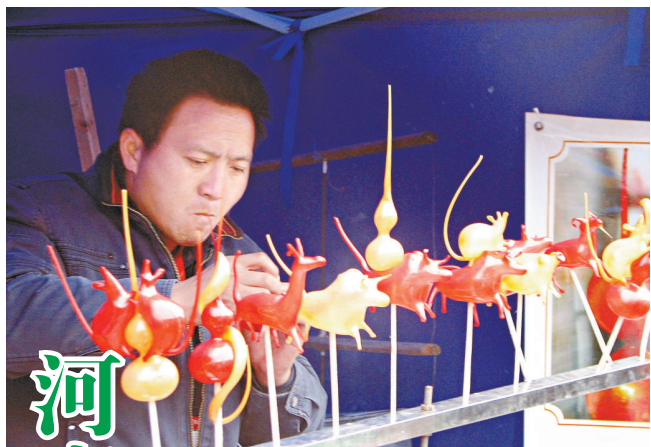
演吹糖人 民間藝人在浚縣正月古廟會表