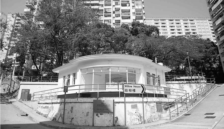
蘇屋邨內一座具現代流線型風格的建築物