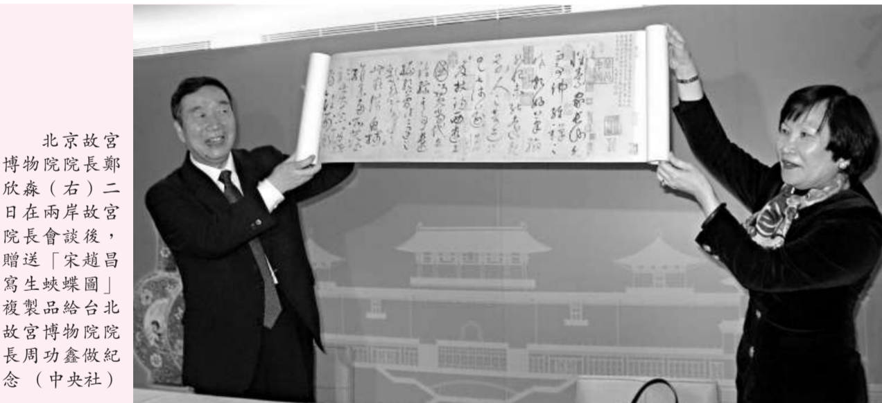
北京故宮博物院院長鄭欣森(右)二日在兩岸故宮院長會談後，贈送「宋趙昌寫生蝶蝶圖」複製品給台北故宮博物院院長周功鑫做紀念

鄭欣森指出，兩院工作人員互稱「同仁」，這意義非同尋常，它和故宮的歷史連接在一起，更多的是共同面向未來。在兩院同心同德的努力下，未來的交流一定會是豐富多彩的好局面。