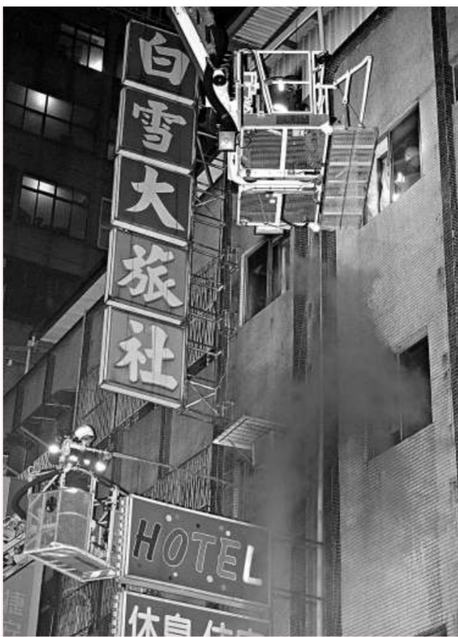
▲消防員利用雲梯車進入發生火警的白雪大旅社

至於慰助金部分，社會局表示，將先發放設籍北市民眾災害死亡慰助金新台幣二十萬元、非設籍北市民眾慰助金二