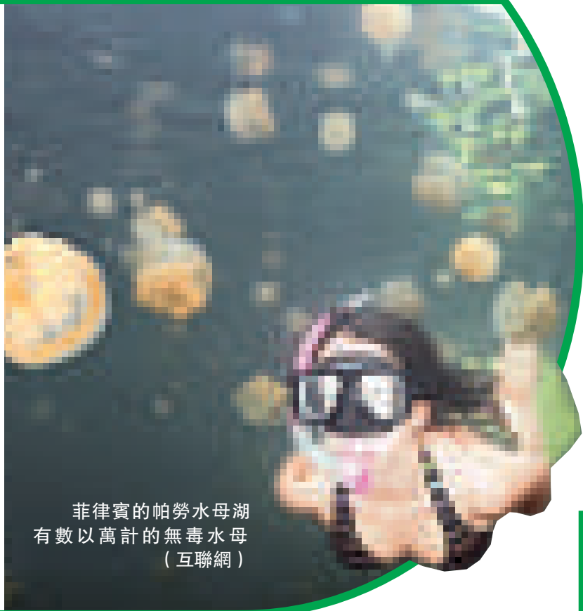
菲律賓的帕勞水母湖 有數以萬計的無毒水母

不過，並非所有人都可以像弗拉德一樣在水母湖中暢游，由於該湖受保護，因此遊客只能在獲得政府頒發的許可證後方可進入。