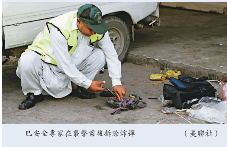
巴安全專家在襲擊案後拆除炸彈