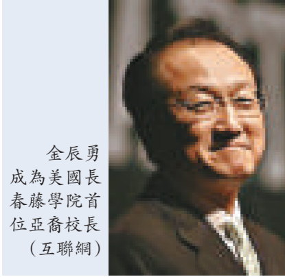
金辰勇成為美國長春藤學院首位亞裔校長