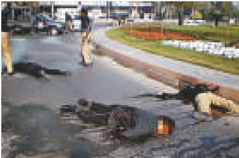
在槍戰中多位警察身亡

國際板球理事會主席戴維·摩根表示，若巴基斯坦此後未能在安全上有明顯改善，理事會將不會把二〇一〇年的板球世界杯的任何賽事安排於巴基斯坦舉行。