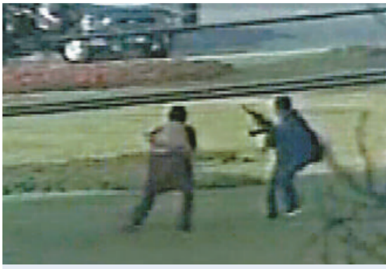
身份不明的持槍者

個裝有數枚手榴彈的膠袋。一輛交通警察用的電單車在附近路面翻側，油缸沾了鮮血。槍手事後逃去無蹤。