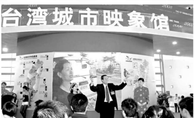
▲去年福州「海交會」台灣21個縣市來榕做整體形象推介，場面十分壯觀

去年五月在福州舉行的「海交會」上，福州市與台北市簽署了加強往來的七項共同聲明，首開兩岸地方政府合作之先河。梁建勇指出，未來榕台在服務貿易以及製造業等方面的合作，尋求的是一種雙引擎模式。即：利用榕台距離近的優勢，以福州為橋樑，台灣先進的服務貿易尤其金融證券業，可以在此設立分支機構，為在福州甚至內地的台企服務。還可以在福州克隆一個台北內湖科技園，形成台北、福州