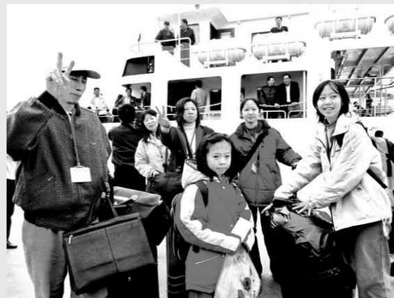
▲榕台一日生活圈正在加快形成，越來越多的台灣同胞從福州口岸登陸

福州市郵政局作為全國唯一的台灣水陸路總包互換局，為保證兩岸通郵順暢，在現有長樂機場郵政航運站附近徵地，籌建海峽西岸郵件總包處理中心，並在福州東部新城內籌建兩岸物流配送處理中心。