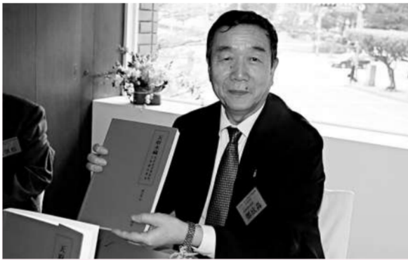
北京故宮博物院院長鄭欣森昨在新書發表會上推介新作