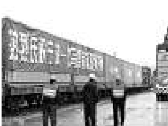
寧波一義烏集裝箱海鐵聯運班列（圖）正式開通。至此，裝載着集裝箱的列車將像公車一樣，頻繁