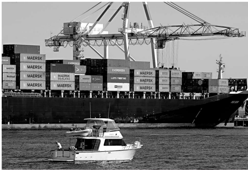
奧芬認為市場上充斥過多新貨櫃船，業界始終要為妄下訂單自嘗惡果

另外，奧芬有信心大多數的德國KG融資機構能挺過今次金融危機，因為不少集裝箱船有長期租約，租家的信譽良好，仍足以吸引投資者會繼續投資船舶工業。