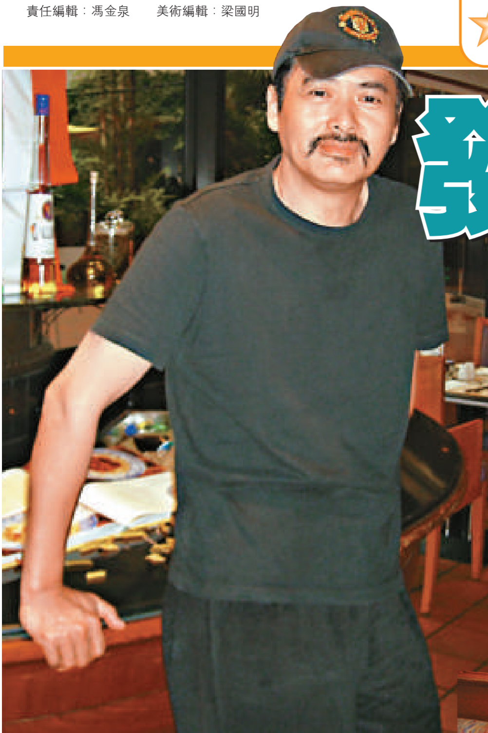
▲發哥支持栢芝阿嬌復出

久未露面的周潤發，最近頻頻亮相宣傳新戲，昨日他與香港傳媒見面時，閒悉歌手關楚耀與衛詩在日本懷疑高買，男方身上更當場搜出藏有大麻，發哥坦言事件影響藝人形象，希望兩人可以吉人天相。