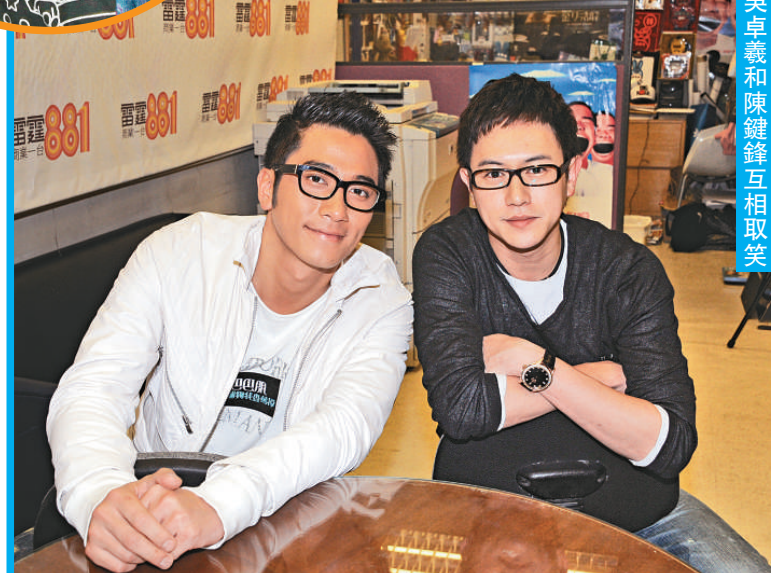
吳卓羲和陳鍵鋒互相取笑