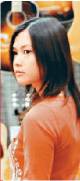
▲YUI 於休息期間不忘創作 ▲Marie（左）與佐佐木希自行 ▲「Stereopony」為新冒起的女子樂隊 ▲YUI 於休息期間不忘創作 ▲Marie（左）與佐佐木希自行 ▲「Stereopony」為新冒起的女子樂隊

「Stereopony」曾為動畫《BLEACH》與《機動戰士高達 00》等唱過主題曲，是新冒起的女子樂隊。今次她們得 YUI 拔刀相助，相信會更惹人注目。