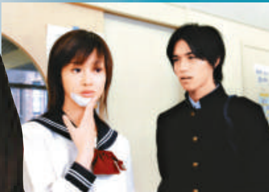
錦戶亮（左）與澤尻英龍華（右）都係搭地鐵好位 ▲錦戶亮（右）憑與澤尻英龍華合演的《一公升眼淚》，成功上