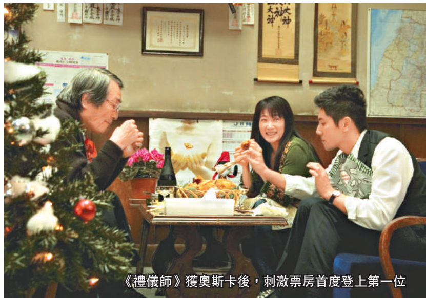
《禮儀師》獲奧斯卡後，刺激票房首度登上第一位

《禮儀師之奏鳴曲》揚威奧斯卡，令近期上映的戲院數目急增。電影已上映了二十五個星期，但在本月二日仍奪得首個票房冠軍，打破了日本電影史上的紀錄。