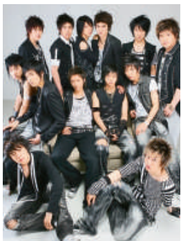
▲歌迷自製海報撐「SJ」，並在大城市派發 ▲「Super Junior」快將推出大碟

組合得悉「粉絲」為他們製作海報後大為感動，表明會繼續努力，以更好的音樂回報支持。