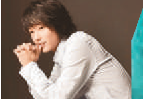
▲李準基今年會專注唱歌 ▲李準基下月開演唱會